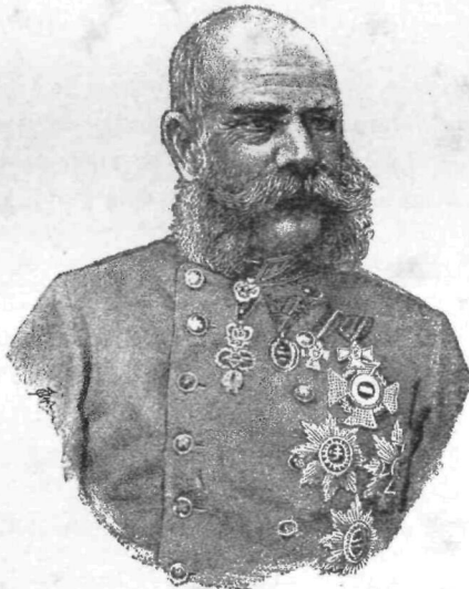
Cesar Franc Jožef I.