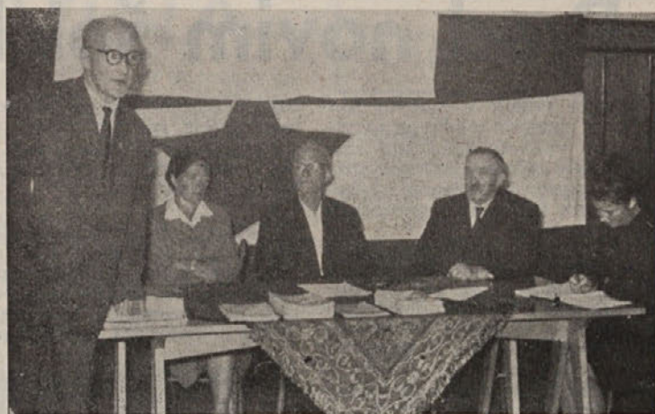
Z ustanovnega občnega zbora čebelarjev, ki je bil 25. avgusta v Ribnici