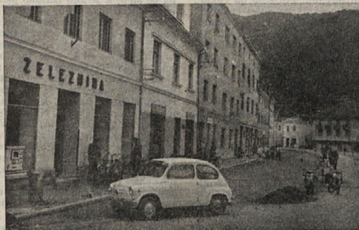
Še malo in parkirni prostori pred »Zelesnino« dobe asfaltno prevleko. Sicer pa je bilo raskopavanja in prekopavanja res dovolj

Uspeh so imeli tudi v kegljanju. Ekipa je zasedla 13. mesto, kar je vsekakor lep dosežek, če upoštevamo, da v Ribnici nimajo ustreznega kegljišča. Tudi športnikom »Gradbenika« iskreno čestitamo.