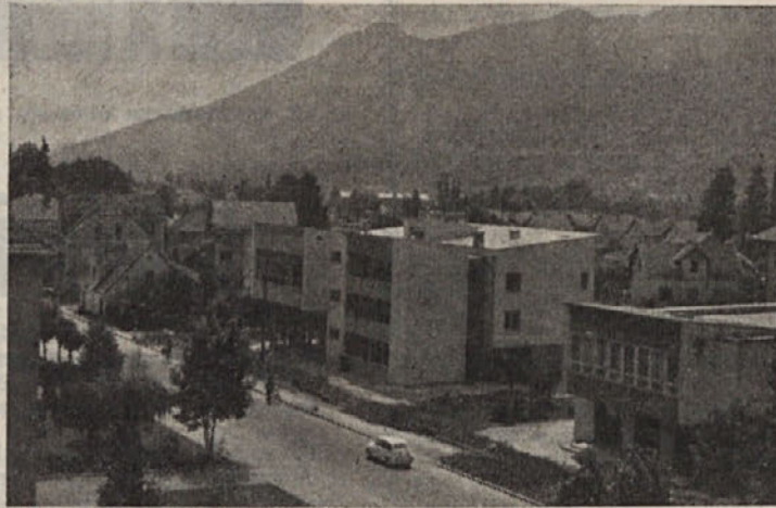
Nov razgled na Kočevje. — Ob Ljubljanski cesti je letos zrasla nova moderna stavba PTT, precej podobna stavbi Soc. zavarovanja.