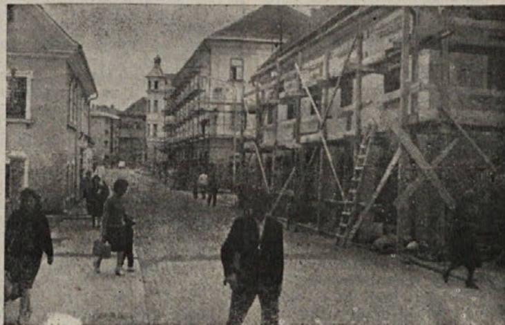
Kočevje pred proslavo: Na ljubljanski cesti urejajo fasade hiš.

17. 9. — Zavezniški zračni desant pri Arnheimu.