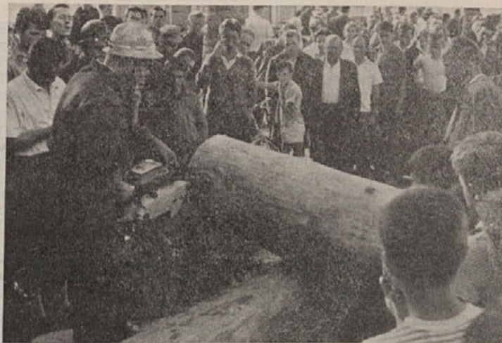
Na VII. republiškem festivalu kmetijskega in gozdarskega strojništva v Kočevju od 23. do 25. 8. so prvič sodelovali tudi gozdarji

Nadalje so komunisti-gospodarstveniki razpravljali še o kupova-