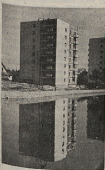
Štirinajst nadstropij

Na Šeškovi šoli je letos v prvi razred vpisanih 94 otrok. Največji problem so na tej šoli prostori, ki jih še vedno primanjkuje, tako da bo pouk od prvega do petega razreda tudi v popoldanskem času in bodo zasedeni vsi prostori šole in gimnazije. Manjka jim še predavatelj za biologijo, kemijo, fiziko in telesno vzgojo. Uredili so samo zunanjo fasado proti novemu športnemu igrišču, ki so ga zgradili skupno z gimnazijo. Na šoli bo 21 oddelkov. Telovadni pouk bo skrčen zaradi pomanjkanja kadra. Učiteljski zbor je začel z delom že 26. avgusta in je uredil vse potrebno za redni začetek pouka.