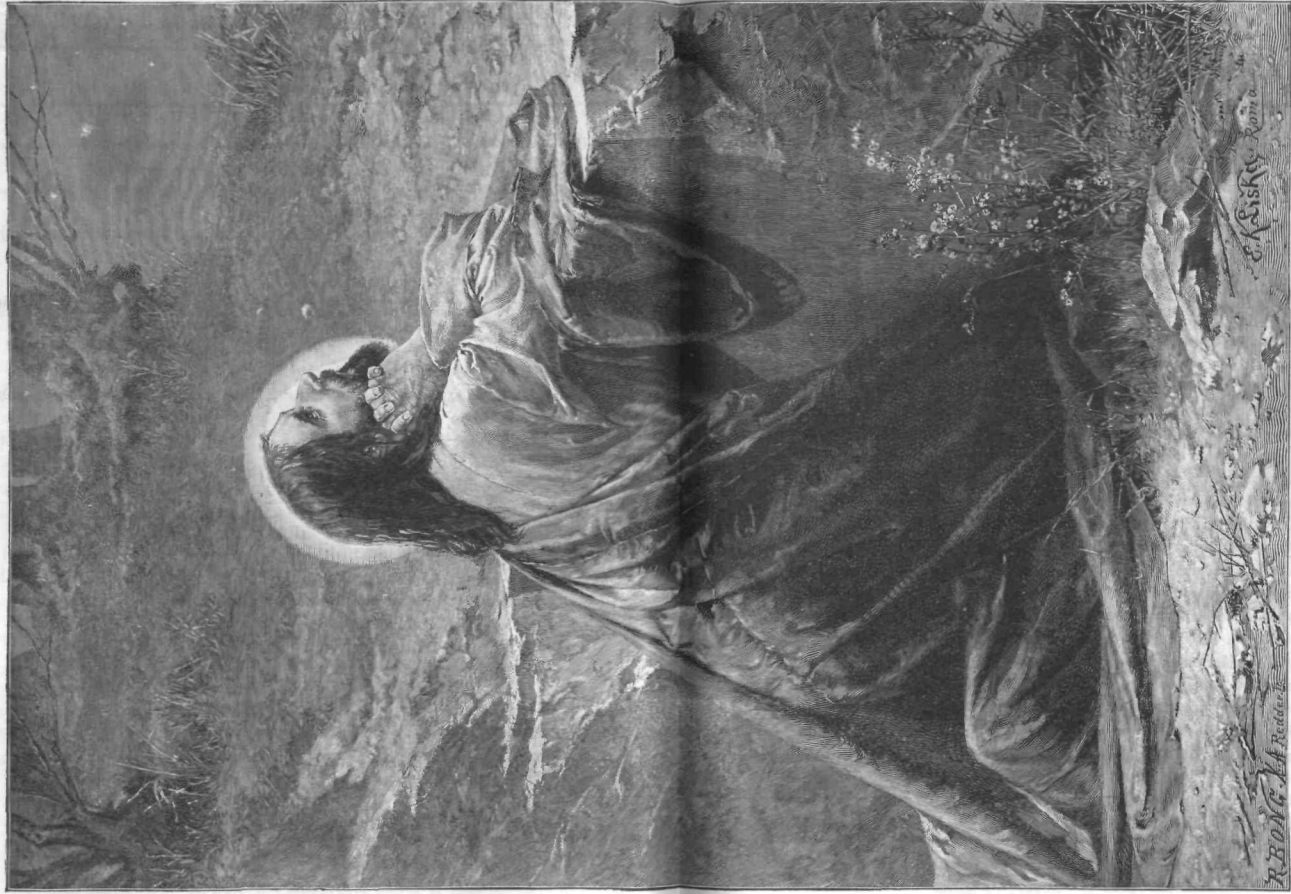
* * * Jezus Kristus na Oljski gori. * * *