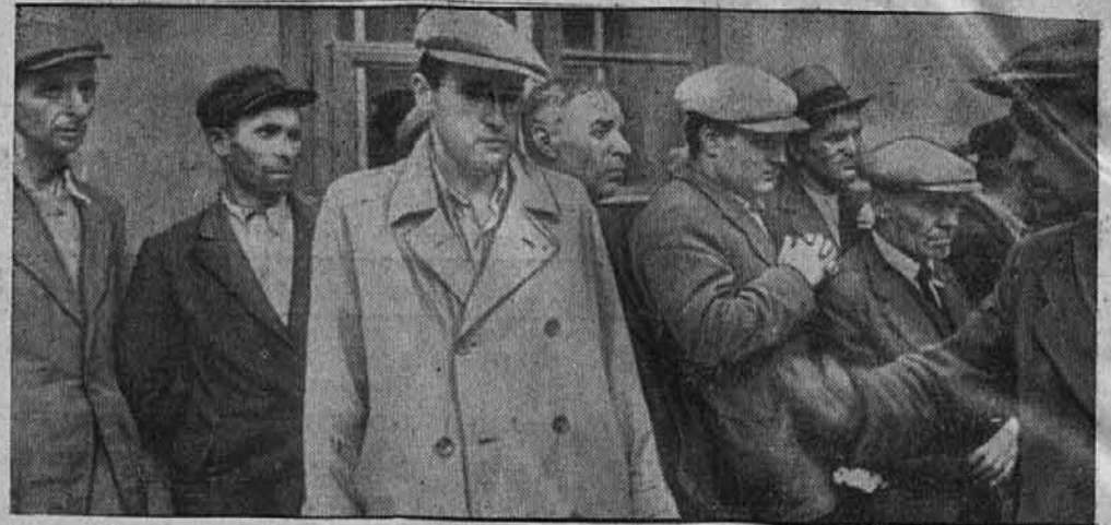
Tako so izgledali bolševiški roparji! Predani bodo zasluženi kazni.

Že samo ta ukrep je dovolj značilen za ves bolševiški sistem, kateri ni zaupal in morebiti tudi ni zamogel zaupati temu orodju silovlade, poleg G. P. U. najvažnejše.