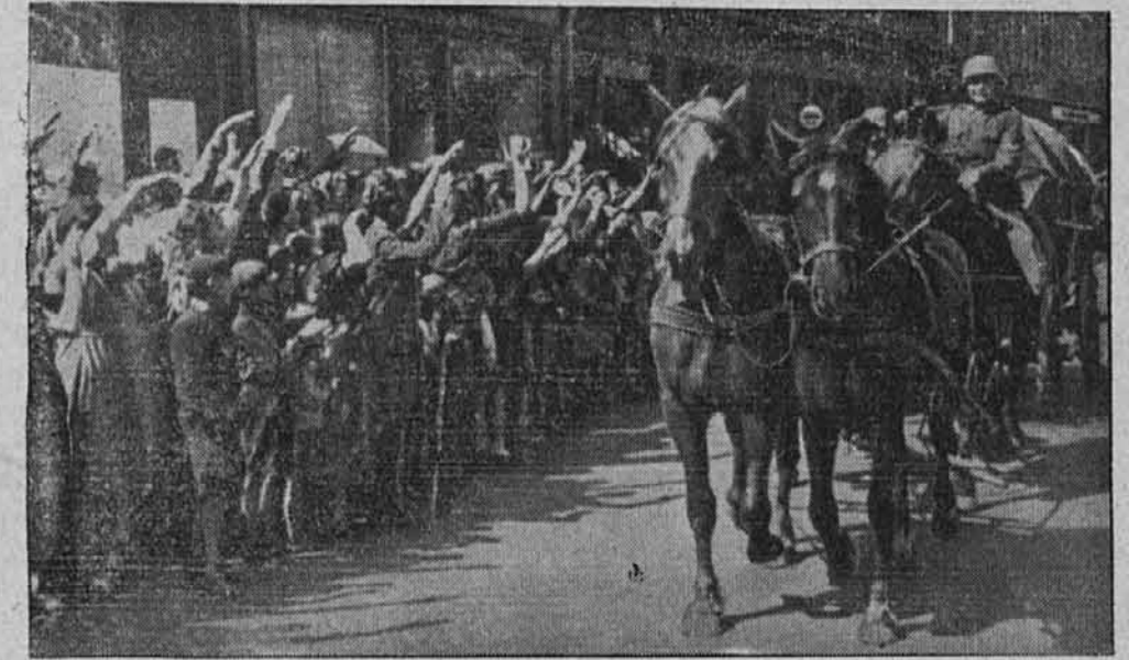
Naše čete kot osvoboditelje ruskega terorja povsod prisrčno pozdravljajo.

Pozno ponoči 12. julija je razglasilo vrhovno poveljstvo oborožene sile po sebnem poročilu: Z drznim naskokom je bila predrta Stalinova linija na vseh važnih mestih. Nadalje je poročalo vr-