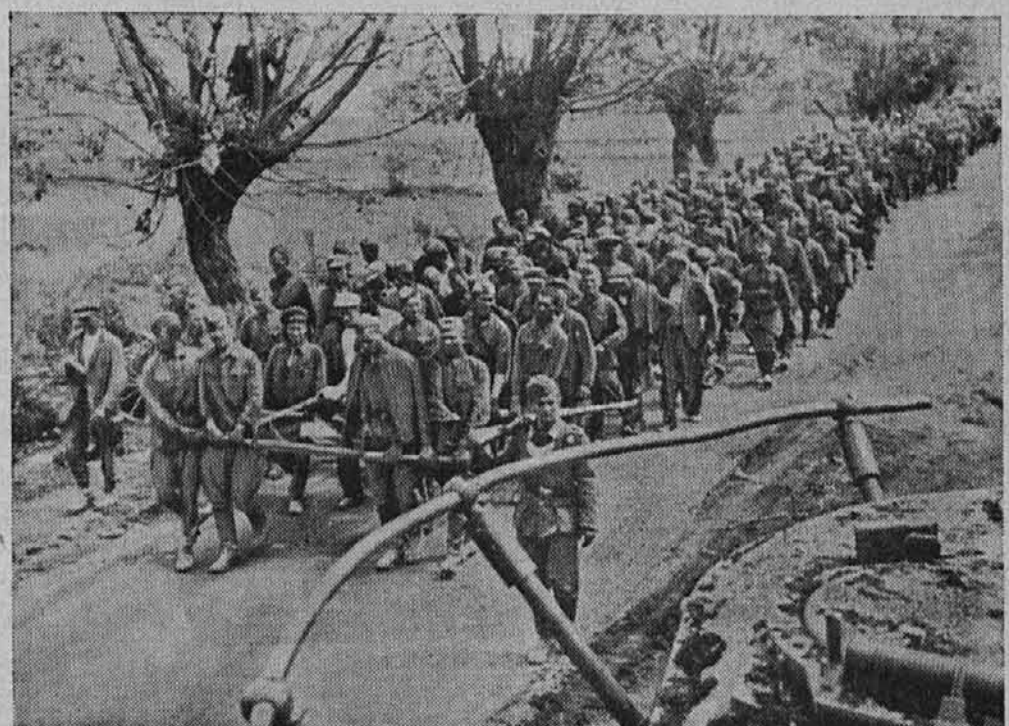
Iz vseh smeri prihajajo nešteti vlaki ruskih ujetnikov.