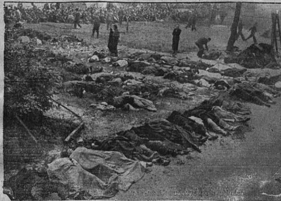
Na stotine zmrovarjenih trupel leži pred ječami GPU, kjer se odigravajo v srce segajoči prizori.

ki se zdijo tebi tako velike in važne, bi li bil potem stopil v klet in moral upati, da ti bo zadal milostni krvnik strel v tilnik? Priznajte, da ste bili vsi zaslepljeni in niste vedeli, kako blizu vam je pretla strašna nevarnost. Upamo, da bo razumel tudi ves ostali svet, zakaj smo tako hitro in močno udarili, ker nismo hoteli priti nekaj minut prepozno.