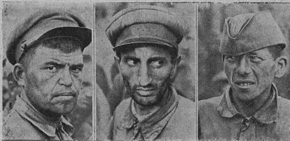
Morilna strast jim žari iz oči.

bil poln mrličev. Videl nisem niti enega mrliča, ki ne bi bil na ostuden način razmrcvarjen, okrnjen, spačen, in sicer na onem delu telesa, kamor cika neprestano misel obrezanih. Pred obrazi se ni ustavil noben človek, ker ni mogel najti ne svojega brata, moža ali očeta. Kar je bilo za rezati, je bilo odrezano, kar je bilo za izruvat, je bilo izruvano, kar je bilo za iztrgati, je bilo iztrgano ali izvlečeno. Ob zidu jarka je bil napol odprt grob. Tam je bila nakopičena tuga. Ni mogoče tega naštevati, Pa tudi nemogoče gledati.