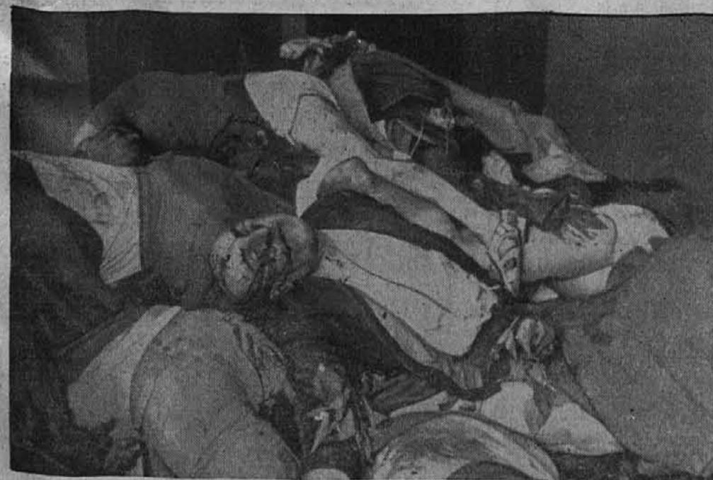
Drug nad drugim so ležala telesa od GPU živinsko umorjenih.

Jokajoče žene in možje s strmečimi obrazi so mi prišli nasproti. Sli smo po stezi. Okrog Citadele je utrdbeni jarek. Na robu jarka so stali ljudje. Iz jarka je vel smrad po trohnenju. Jarek je