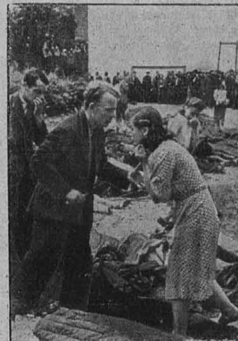
Našli so svoje umorjene starše.

Mi ne branimo danes samo Evrope, branimo svet pred kugo in pred mučenjem in mrtvaškimi kletmi. Branimo bedaste švicarske malomeščane, zaslepljene severne Amerikance, branimo človečanstvo pred podganami, ki sme jih v njihovih pravih in zadnjih skrivališčih izslediti in videli pri njihovem strašnem početju. Da smo to storili v zadnji uri, je krivda Angležev. Kakšen boj nas še čaka, je vedel naš Führer že od vsega početka. Častimo njegov molk, premislimo kako mu je bilo težko. Naj gre vsak od nas sam s seboj pred sodišče, kakšne ugovore je imel napram temu ali onemu. Mogel jih je imeti, ker ni vsega videl in vsega vedel. Če mu pa sedaj sij ognja razjasni o končni veliki zmagi, potem mora uvideti, kako malenkostno in brezsmiselno neumno je izgubljal čas za svoje ugovore, in kako je vse, kar se je zgodilo in kar se še zgodi mora, se mora smatrati samo s tega stališča. Kako bedasti so vsi prepri o cerkvah, kronanju, šolah, prostosti itd. in o dozdavnih velikih vprašanjih. V kletih smrti, podzemeljskih celicah mučnikov, ne veljajo ta vprašanja, tam