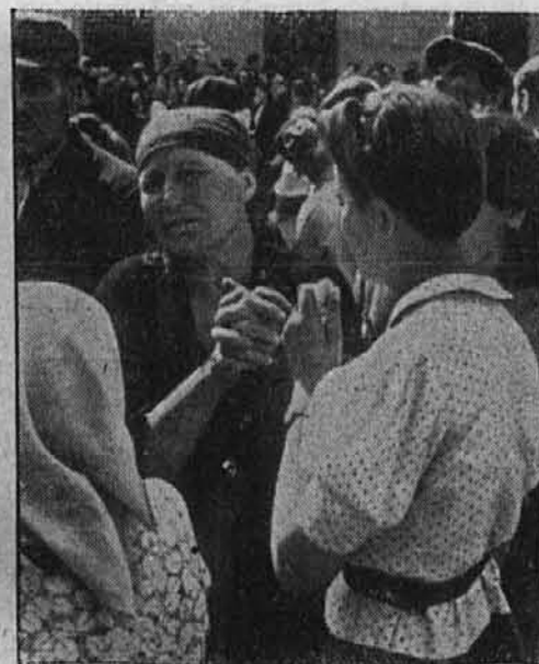
Jokajoče žene in možje s strmečimi obrazi so mi prišli nasproti...

Citadela leži na južnem koncu mesta. Dospeli smo od Tarnopola. Ko smo ob povratku prišli mimo Zitadele, sem opazil, da je velika, visoka baročna stavba na vrhu preko utrdbenega zidu bila zakrita z okni, ki so propuščala svetlobo samo od zgoraj. Mimogrede sem mislil, da je jetnišnica. Na vnožju gradu Burgberga so bili razbiti sovjetski tanki in vozila, ki še niso bila odstranjena. Na cesti je bil velik promet usmerjen proti fronti. Voz se je moral zaustaviti. Vprašal sem stražo, zakaj gre tja gori po tej ozki poti toliko ljudi in stražar mi je odgovoril, da tam gori ležijo mrtvi Ukrajinci. Zaposil sem svojega tovariša, da naj zapusti voz in me spremlja tja gori.