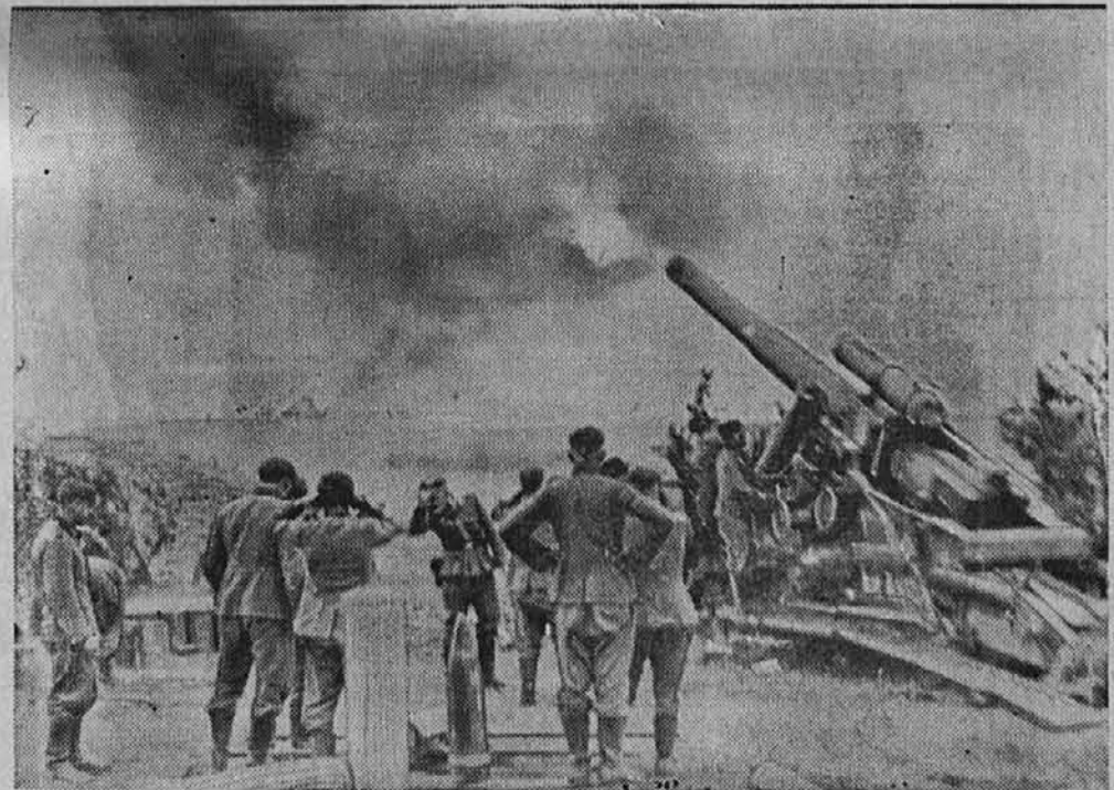
Naše težko topništvo ruši ruske utrdbe, da postanejo zrele za naskok.