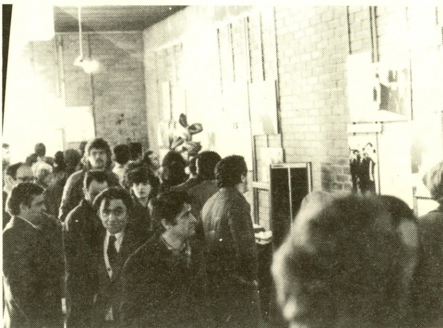
Veliko zanimanja je veljalo tudi za knjigo Edvarda Kardelja