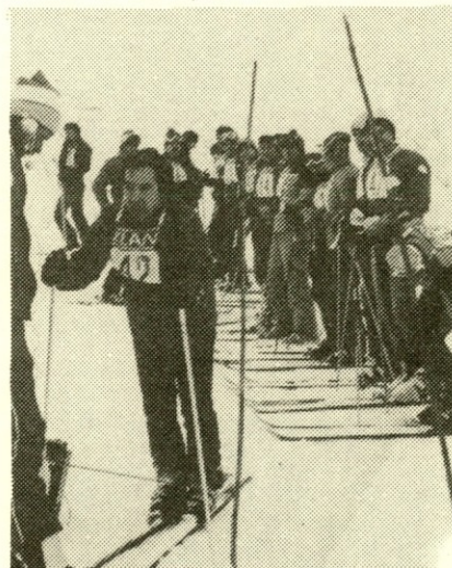
Troboj v veleslalomu

Čas tekmovanja se je naglo približeval. Progo so postavili na Pungartu in ne na Koprniku, kot je bilo predvideno. In zdaj se je šele pričelo. Mazanje smuči, ugotavljanje temperature snega, kakovost snega – zakaj vse to je izredno pomembno pri tekmovanju in vse to je spremljala še nervoza. Vsakdo je vedel, da je uspeh tozda odvisen od vsakogar, zakaj ekipni vrstni red so dobili s seštevkom petih najboljših rezultatov vsake ekipe. Tekmovalci so tekmovali v treh starostnih kategorijah, tekmovalke pa v enotni kategoriji.