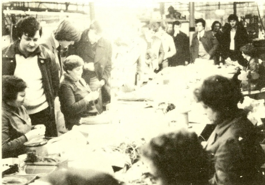
Seminaristi v tozdu Elektronika, kjer sestavljajo sklope novega barvnega televizorja Koerting s šasijo K 9

Po kratkem informativnem uvodu, ki ga je podal Vili Cimperc, dopolnil pa Marjan Šramel, se je razvila pestra razprava.