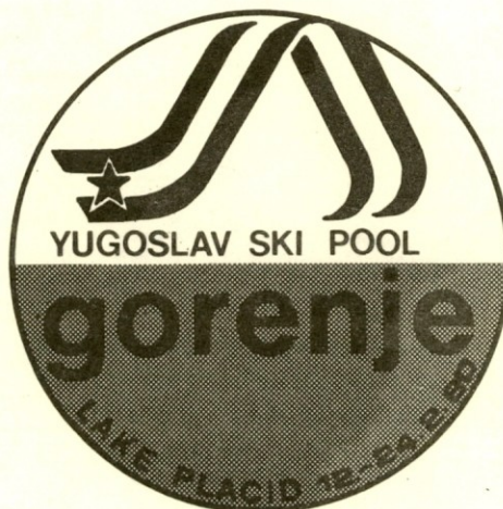
Znak, ki ga nosijo jugoslovanski reprezentantje v Lake Placidu