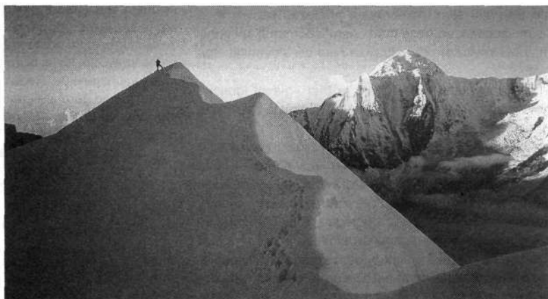
Aklimatizacijski vzpon: na južnem grebenu Singu Čulija (6501 m), v ozadju Hlunčuli (6441 m)

Odpravi Singu Čuli sta pomagali KOTG in KA. Sponzorirali so naju Belin — Ilirska Bistrica, SCT, Pivovarna Laško, GIK d.o.o., Primorske novice, Liwel d.o.o. — Velenje in Vegrad Zaključna dela. Športna trgovina Sport Market, Tivoli naju je oskrbela s športno prehrano proizvajalcev Weider in Strenght Sistem, USA. Vsem se iskreno zahvaljujemo.