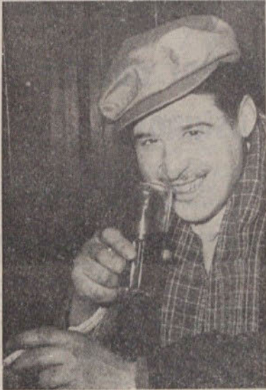
Se enkrat več...

Vsak občan ima za prihodnje leto tudi svoje želje. Nekdo si želi to, drugi ono, vsak želi svoje in to pove na svoj način. Seveda nimamo možnosti vprašati vse naše občane, kakšne so njihove želje za leto 1962. Nekaj pa smo jih nameroma poiskali na njihovih delovnih, medtem ko smo druge »do-