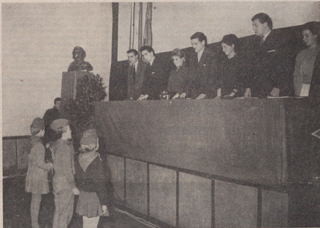
Pionirji iz Zadobrove so izročili delegatom mladinske konference šopek cvetja s številnimi in toplimi željami

OB LETNI KONFERENCI MLADINSKE ORGANIZACIJE V NAŠI OBČINI