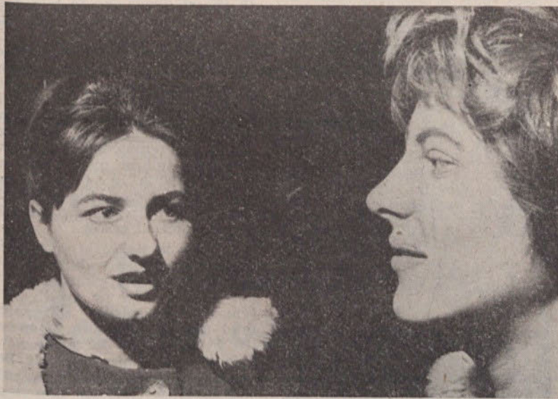
Najina želja je: uspeh pri delu in sreča v življenju