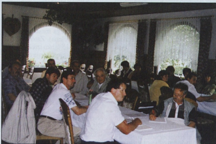
Udeleženci seminarja so se najbolj zanimali za vprašanja v zvezi z delnicami.

Ko so govorili o prometu z delnicami, so ugotovili, da so delnice praviloma prosto prenosljive. Edina možnost omejitve prenosa (prodaje