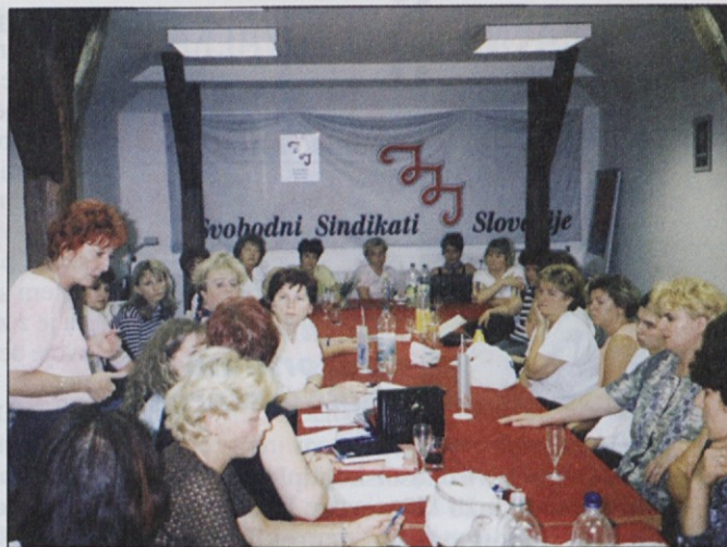
Delavke Frizerstva Maribor so lani večkrat stavkale za svoje pravice.

Po dolgi negotovosti so mnoge delavke zadovoljne, da so si socialno varnost vsaj za krajši čas zagotovile na zavodu za zaposlovanje. Strah jih je namreč bilo, da bi morale štiri ali pet mesecev hoditi na delo, ne da bi prejemale plačo, kakor se je to