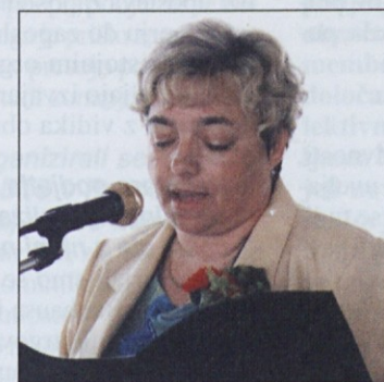
Program je pripravila in povezovala Alenka Klincov iz Celja.