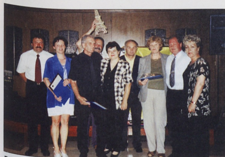
Dobitniki priznanj SDPZ Slovenije

ali nakupa) delnic je vezava na so-glasje družbe, kar mora urediti statut družbe. Omejitve določa tudi zakon o prevzemih, ki na osnovi delniškega sporazuma omogoča oblikovanje družb pooblaščenk. Te družbe lahko oblikujejo delničarji za ohranjanje notranjega delničarstva in notranjega prometa z delnicami, če združene delnice zagotavljajo 25 odstotkov glasovalnih pravic.