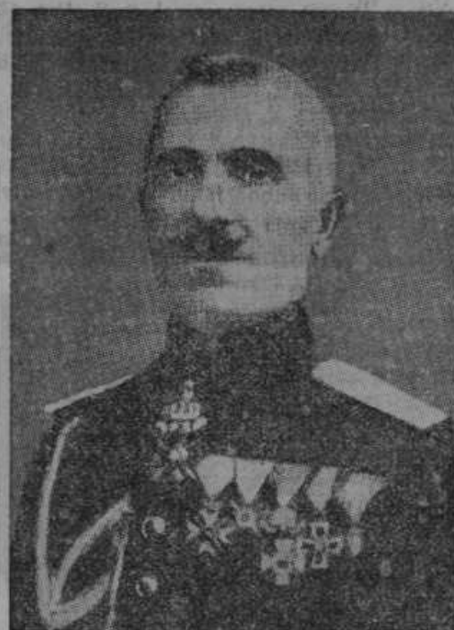
General Zlatev, novi predsednik bolgarske vlade.

Pometamo dalje, dokler je še kaj zimskega blaga. Vešur barhent 7 Din, flanela 5.50 Din, volneno 16 Din, snežke 20 Din itd. Stermecki, Celje.