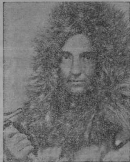
Ameriški admiral Byrd, ki je raziskoval skoro dve leti južni tečaj, se vrača nazaj v domovino.