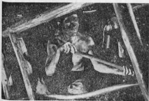
V minah v Belgiji

Kadar naš človek pride v Belgijo, narprej ga pe- ljejo v kantino, kier bo jedu in spau. Okuole rudarskih jam je vse pouno kantin. V kantinah so venčpart go- spodari Belgjanci, je pa pouno tudi taljanskih kantin in tlé an tamlé najdeš tudi kako slovensko. Kantin je dobrih in slabih; slovenski djeloue pa če le more gleda se zateč' h slovenskemu kantinirju, kier le tam