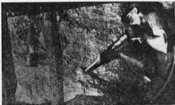
V minah v Belgiji

znesli kantinirjem, an potlé nesli damou prazné »gá- jofec«. V Belgji vse smrdì po uògju, luht, drjevje, trava, vodà, sadje, živež, obljeka, vse je umàzano od črnega prahù uògja, vse je úmarno. Tam ne vidiš čistega sonca, popounoma jasnega nebà; če prù včasih nje maglé je pa kadiž od fabrik, ki so buj gosté, kù pri nas ko- stanji. V Belgji todà nje zdreu svjet kakor po naših nediških in rečanskih dolinah in po naših breguovih.