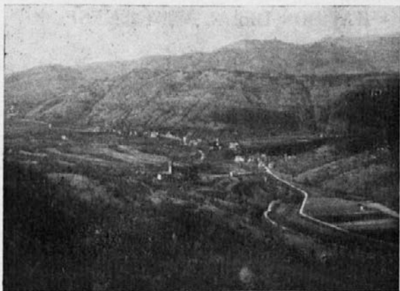
Podutanska Dolina iz Utane