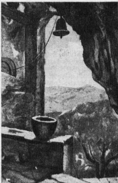
Vhod v Landarsko jamo kamor so se zatekali naši pradedje pred Turki