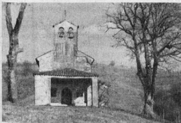
Cerkvica sv. Antona Puščavnika v Gorènji Mjersi, ustanovljena l. 1441; glavni kraj »Mjerske Banke«.

lipo, pri cerkvici sv. Kvirina, pod Šempetrom in je sklepal o skupnih zadevah vseh slovenskih vasi; po potrebi je bil sklican tudi večkrat na leto. Predsedovala sta mu, navadno, po vrsti Landarski in Mjerski Veliki Župan. Rodoljub