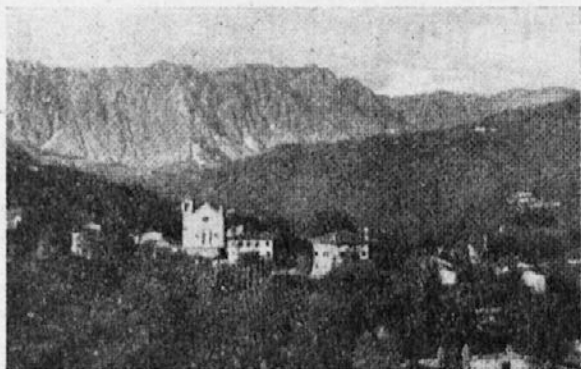
Hoja (Hoja slava) nad Tarčentom