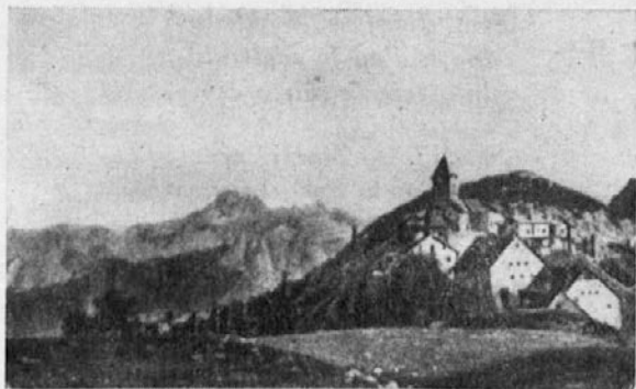
Sv. Višarje m. 1792