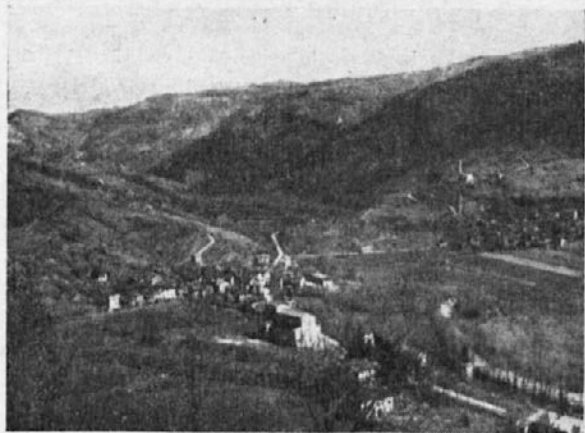
(Podutanska Dolina) - Gorenja Mjersa in Sv. Lenart

Na desni strani, pod Platišči, se izliva v Nedižo potok Namlén, ki prihaja izpod Čufin, in pođ Prosni-dom potok Legrada, ki prihaja izpod Krnic. Odtod naprej Nediža zavije na levo, okoli Mije, in teče skozi 12 km po jugoslovanskih tleh skozi Podbelo do Robiča, nakar obrne po ozki dolini med Mijo in Matajurom in pri Suhem potoku, stopi na italijanska tlà, v Nediško dolino.