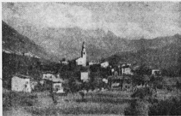
Ràvenca v Reziji (Prato di Resia)

REZIJA, ali rezijanska Bela, izvira pod Babo (Kanin) in teče po rezijanski dolini dokler se ne izlije po 21 km v rëko Belo (Fella) pri Rezijuti.