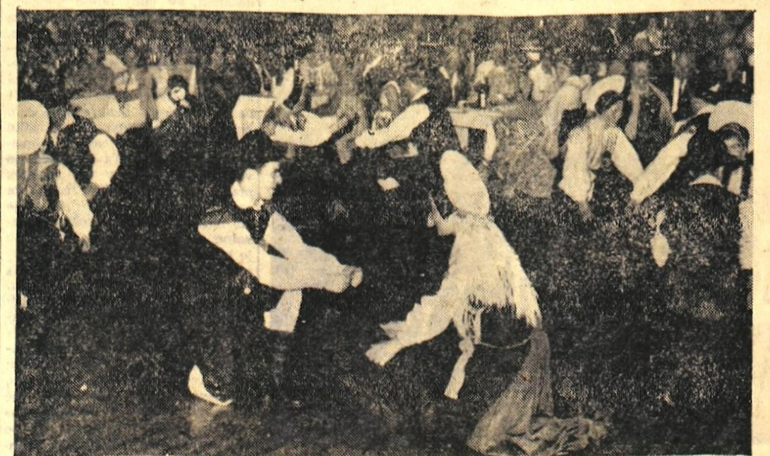
Na sliki: Venček gorenjskih narodnih plesov — zadnja točka sporeda — je najbolj navdušil številne gledavce.