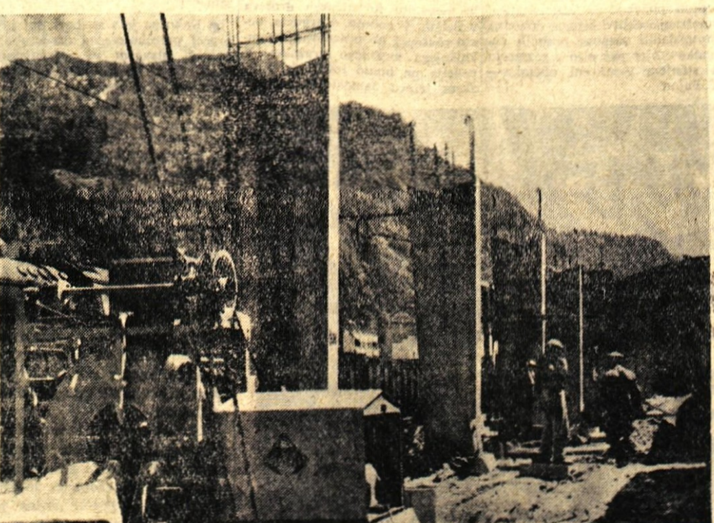
Peron na jeseniški železniški postaji je ob povečanem prometu in številu potniških in brzih vlakov postal pretesen. Zato so sklenili, da ga bodo zainovirali, mestov, ki so bili prej namenjeni delavcem pri delu.

Tudi hotelu na Planini pod Golico, ki spada pod »Pošto«, je uspelo dobiti nekaj stalnih gostov, še več pa jih bo v avgustu, saj je že sedaj precej sob rezerviranih za ta mesec. — M. Z.