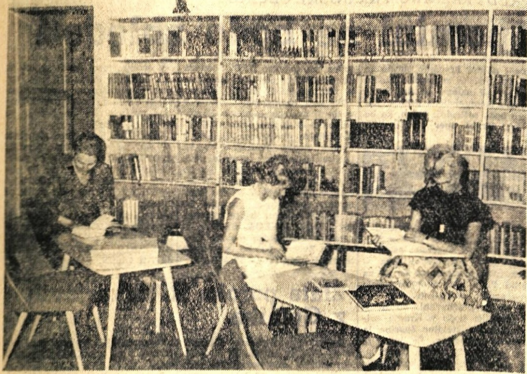
Ceprav je poletje, urejena tržiška knjižnica ni prazna