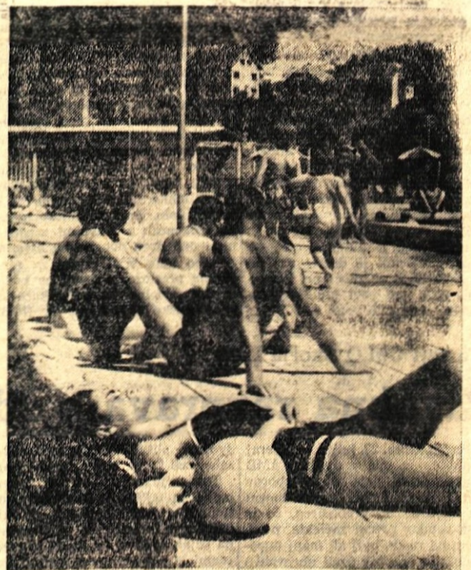
Na kopaljšču v Tržiču je vedno mnogo kopavcev