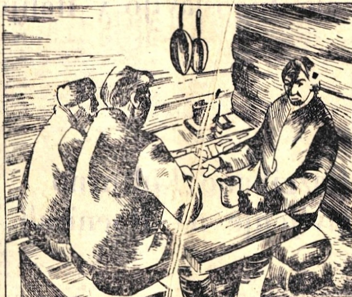
122. »Midva sva resna kupca,« je rekel Kriš. »Stavbišče ni vredno deset tisočakov, tudi deset centov ne! Vendar ti bom jutri plačal v Severozahodni banki. Ko prejmeš denar, oddi iz tega kraja. V banki ti bom očitno izplačal 25.000, ti pa mi boš 15.000 vrnil na skrivaj.«