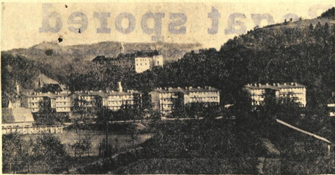
Štirje stanovanjski bloki so že, sedaj pa gradijo še tri.