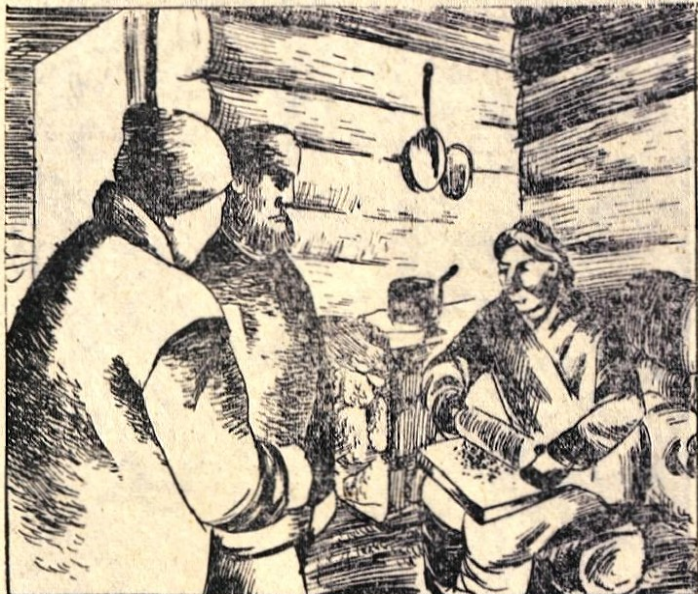
121. »Noter!« je osorno zarenčal Sanderson, ko sta potrkala na vrata njegove kočje. Cepel je pri kamnitem ognjišču in drobil kavo. »Kaj bi rada?« je hripavo vprašal. »Prišla sva zaradi kupčije.« je rekel Kriš. »Pravijo, da imaš na prodaj stavbišče za mesto. Koliko zahtevaš?« »10.000 dolarjev!« se je zadril Sanderson.

Priredil: Stanko SIMENC Riše: Janez GRUDEN