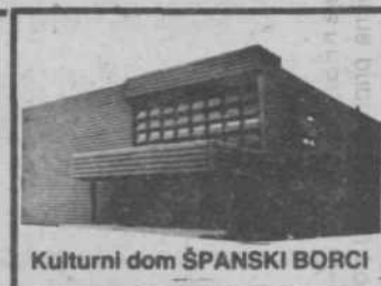
Kulturni dom ŠPANSKI BORCI

Zveza kulturnih organizacij Ljubljana Moste-Polje je 13. novembra priredila v kulturnem domu Španski borci koncert Koroškega akademskega okteta.