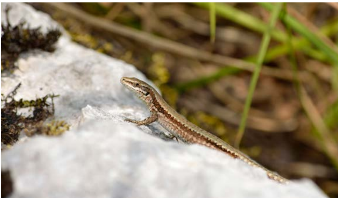
Trditev iz Spomenice : »Nadalje varujmo tudi vse kuščarje (kuščar, martinčki, slepič) in vse vrste krastač [...], ker so za poljedelstvo in vrtnarstvo neprecenljive važnosti,« je dober primer potreb ohranjanja herpetofavne in obenem vpogled v takratno razdelitev kuščarjev. Na sliki je pozidna kuščarica ( Podarcis muralis ). (foto: Blaž Kekec, 13. VII. 2019)