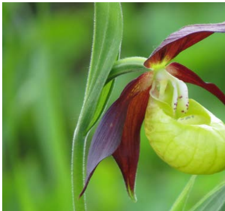
V Spomenici so leta 1920 za varovanje predlagali 13 rastlinskih vrst, ki jih [...] trgati, ruvati, prodajati .« To je veljalo tudi za kukavičevko lepi čevljec zapisali, da »se je v Kamniških planinah že po večini zatrla. Gozdarji, lovci popolen pogin.« (foto: Alenka Mihorič, 16. VI. 2013, Zelenica)