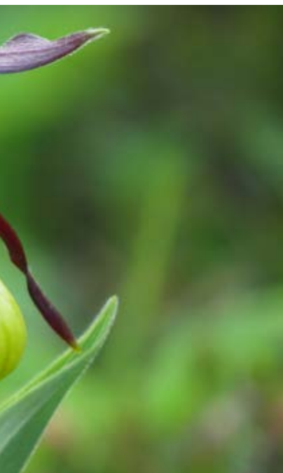
je »prepovedano [...] pod strogo kaznijo ( Cypripedium calceolus ), za katero so in drugi jo prodajajo na debelo; preti ji

Tokrat, kot nadaljevanje minulega Fotoživa, prav tako objavljamo fotografije vrst, povezanih s Spomenico (1920). Svoje fotografije za naslednjo izdajo lahko pošljete do 15. aprila 2021 na bilten.trdoziv@gmail.com .