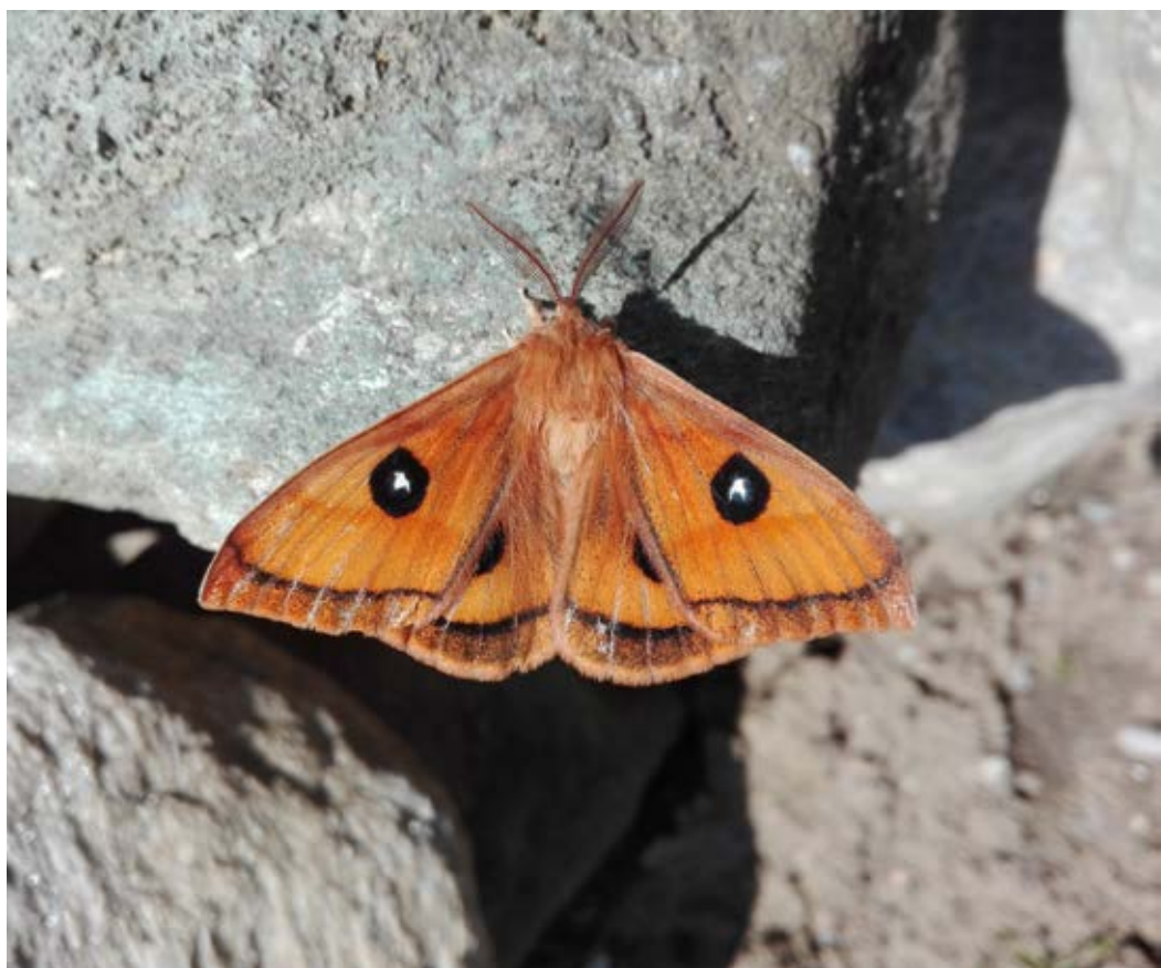
»Jame, špilje naj pridejo v državno last in v oskrbo odseku (društvo) za varstvo prirode in prirodnih spomenikov, ki bo vhode najbolj znamenitih zavarovalo in dovoljevalo vstop le v znanstvene svrhe,« je bila ena od osrednjih točk Spomenice . Včasih na vhodu v jame najdemo tudi vrste, ki za to okolje niso tipične. Kot ta gosenica belega t ( Agria tau ), vrste nočnega metulja, ki je sicer v Sloveniji zelo pogost in splošno razširjen. (foto gosenice: Eva Pavlovič, 16. V. 2020, pred Vranjo jamo; foto odraslega: Aja Zamolo, 24. IV. 2020, Fram)