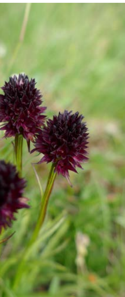
Spomenici potrebnimi varovanja, je bila tudi rhellicani , ki smo jo v preteklosti zmotno – pod tem imenom je bila v Spomenico tudi kako jih ločimo med seboj, si preberite v 17. VII. 2019, Mangartsko sedlo)