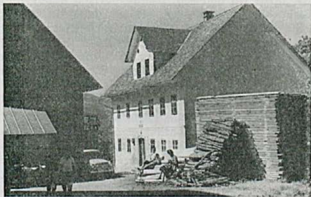
Groharjeva rojstna hiša v Spodnji Sorici