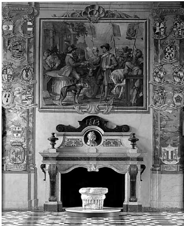
Slika 2: Knežji kamen pod Fromillerjevo fresko obreda ustoličenja koroškega vojvode v Grbovni dvorani Deželne hiše v Celovcu.

še sredi 18. stoletja imelo ustoličevanje v zgodovini Koroške. 11 Vedno znova jih je spominjala in opominjala, da so bili oni, se pravi dežela, tisti, ki so postavljali vsakokratnega vladarja. Bila je prispodoba koroške stare in izjemne zgodovine, na katero se pri doseganju svojih političnih ciljev niso sklicevali samo koroški deželni stanovi, ampak tudi vladarska dinastija Habsburžanov, ki je že kmalu po sredi 14. stoletja z njo utemeljevala svoj nadvojvodski naslov. 12