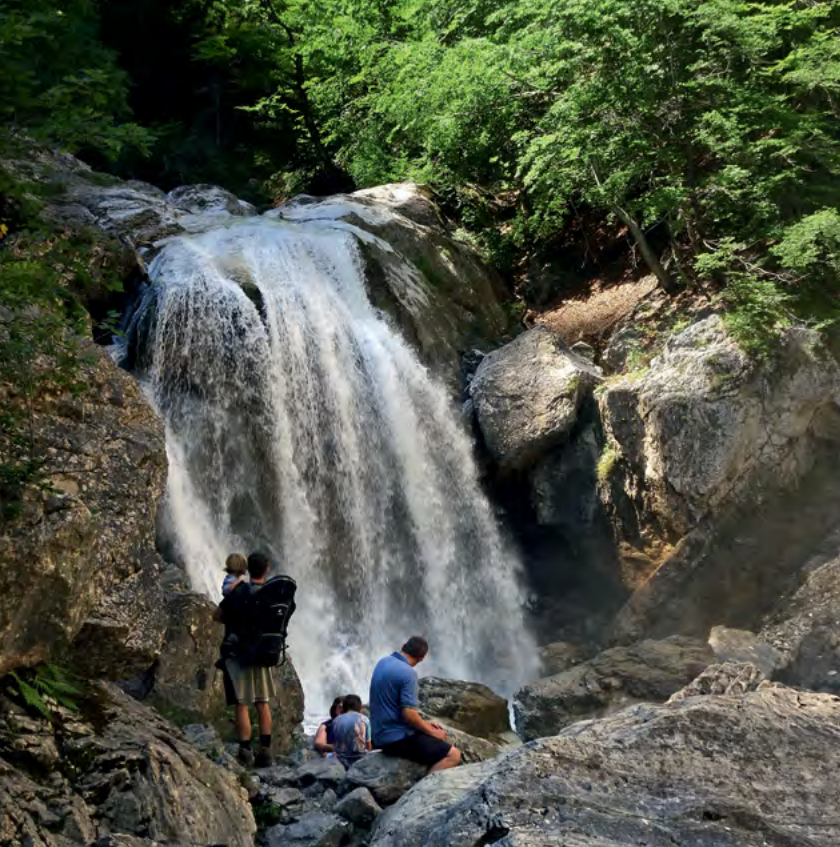
Slapovi v soteski Garnitzenklamm

mušnice sredi gozda narediti doživetveni park. Glavni razlog za naše poletne selitve na Koroško pa so seveda tamkajšnji hribi. Dovolj so mi nepoznani, da so mikavni, dovolj čedni, da so pohajkovanja po njih nadvse zadovoljujoča, in hkrati ne tako prišpiceni, da bi se domov vračala depresivna, češ kaj mi je treba