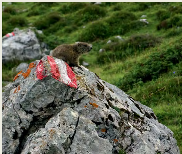
Svizci so najmanj sramežljivi v dolini Valentintal.

Karnijske Alpe običajno povezujemo z Italijo, vendar