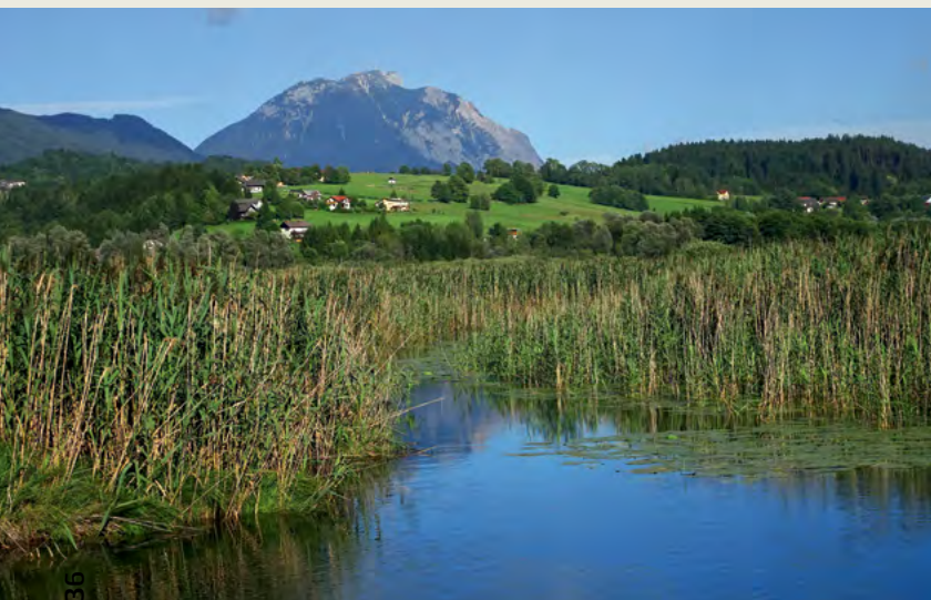
Kopanje v Prešeškem jezeru je samo za ljubitelje vodnega zelenja, pogledi na Dobrač v ozadju pa so čudoviti.

V poletni sezoni v Ziljski dolini nikjer ni daleč do ohladitve. Zilja sicer ne teče več tako bistro kot v pesmi in njene zablatene plažice so uporabne kvečjemu za metanje kamnov v vodo, vsekakor pa sta obiska vredni soteski Garnitzenklamm in Mauthner Klamm. Bolj ali manj dodelana kopališča in bazeni so v vsaki drugi vasi, omeniti pa velja še Prešeško jezero/Pressegger See (za ljubitelje kopanja med trstičjem) in nekoliko bolj odmaknjeno, a precej lepše Belo jezero/Weissensee (povečana različica Bohinjskega jezera).