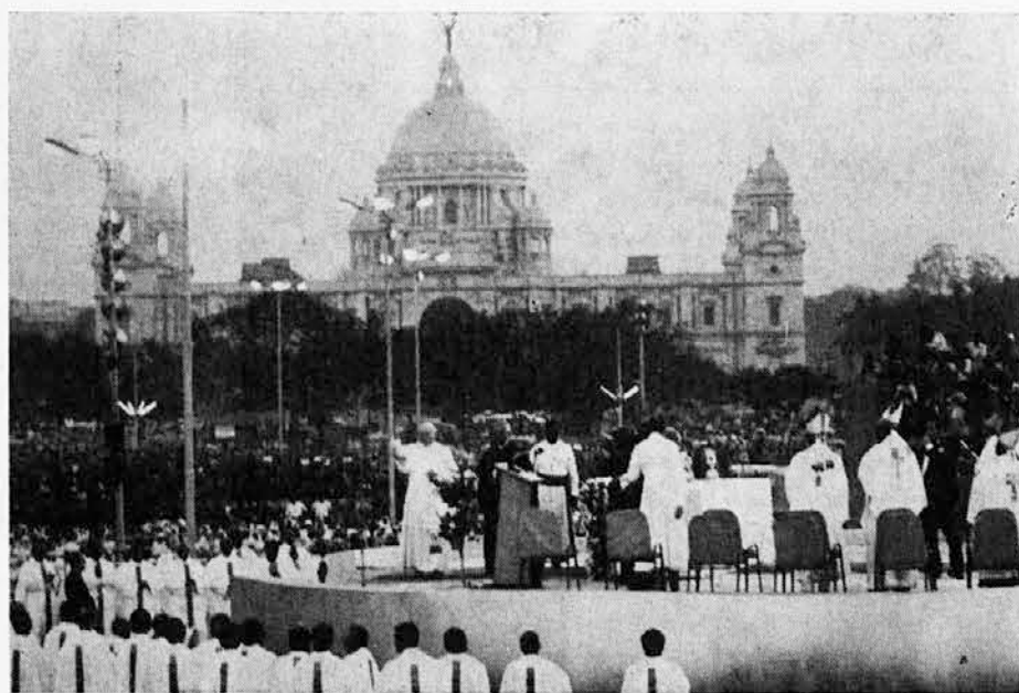
Papež pred pričetkom evharistične daritve v parku Brigade Parade Ground v Kalkuti. V ozadju mogočni Spomenik zmage