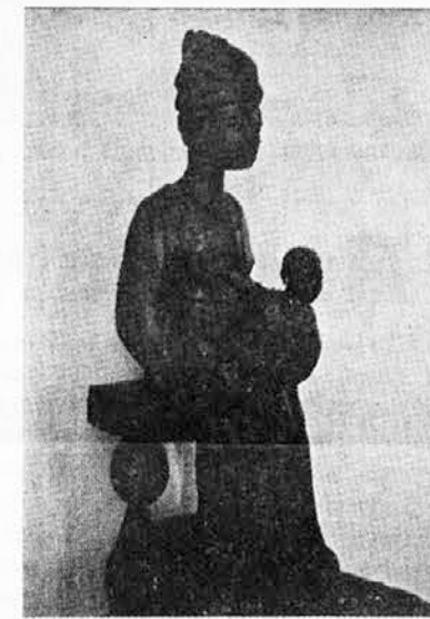
Kip Matere božje v izdelavi črnkega umetnika z Madagaskarja

■ UGANDA - DEZELA NEMIROV. Ta srednjeafriška dežela, ki se kar ne more notranje umiriti, je misijonsko ena najbolj razvitih afriških dežel. Po zadnji statistiki je med 12 milijoni in pol prebivalcev kar 40 %, t. j. pet milijonov katoličanov. Duhovnikov pa je dosti premalo: 500 škofijskih in 300 redovnih. Misijonskih bratov je 267, redovnic pa 2158. V Ugandi uspešno delujeta tudi dve domači redovni družbi, ena ženska in ena moška. Obe se posvečata dušno pastirskemu in vzgojnemu delu, pomagata pa tudi na zdravstvenem in socialnem področju.