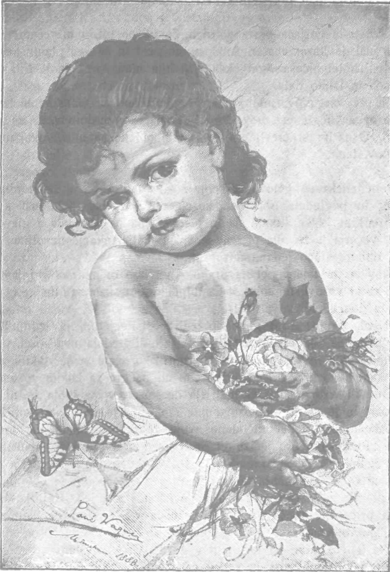
◁ Cvetje in metulj ▷