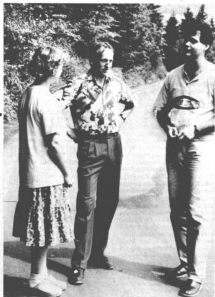
Niso skrivali zadovoljstva, ko so se ozirali po cesti.