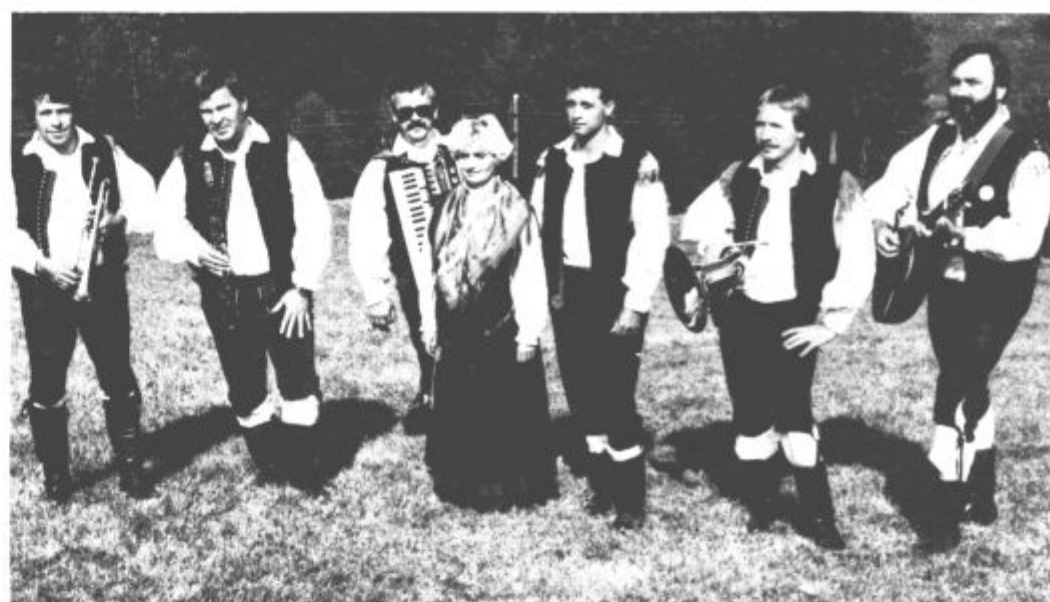
Šaleški fantje — prvi po oceni strokovne komisije...

Nagrada za najboljše besedilo : Tone Videc — Želje rudarjevega sina (Šaleški odmev), priznanje za sodelovanje Bratje iz Vitanja.