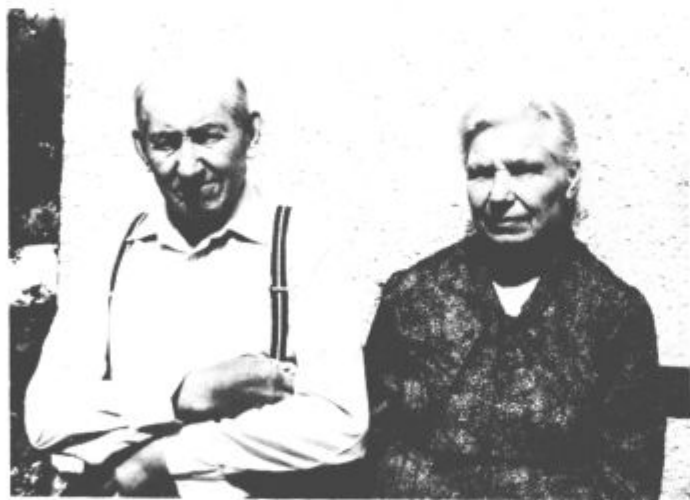
Zlatoporočenca Veternik dan prej, predno sta odšla še enkrat pred matičarja.