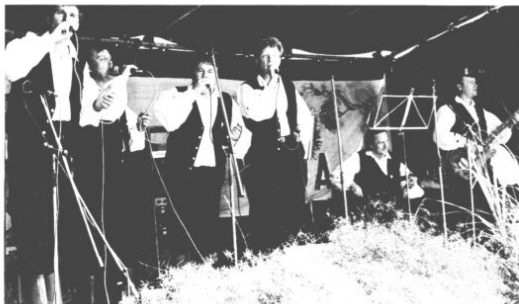
... Fantje izpod Rogle — po oceni občinstva