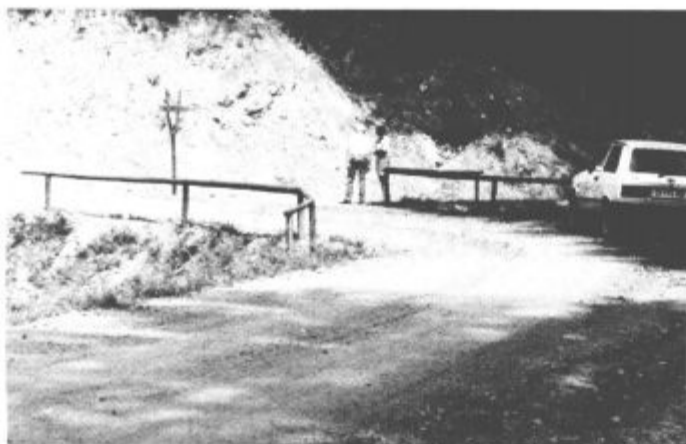
Del odseka od Ramšakovega ovinka do Koželnika, kjer je bilo opravljeno zelo zahtevno delo.

Gre za cesto, ki je življenjskega pomena za ljudi v tem koncu, velikega pomena tudi