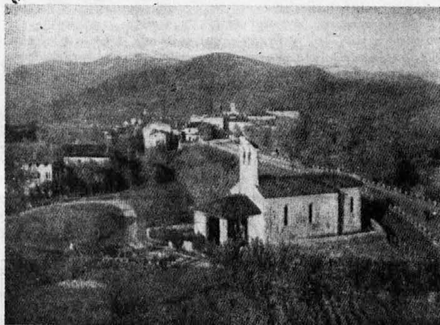
CERKEV SV. KVIRINA PRI SV. PETRU SLOVENOV