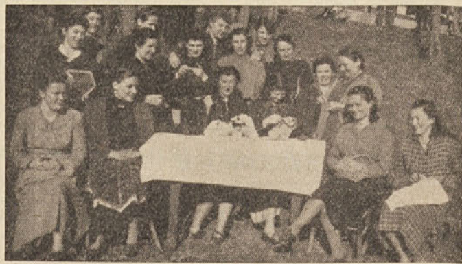
Zadružnice iz Roba, zbrane pri ročnem delu, pošiljajo vsem tovaršičam na območju OLO Kočevje združni pozdrav in jim želijo obilo uspeha pri njihovem delu