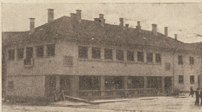
Zadrugi dom v Sodražici