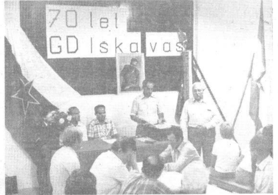
Svečana seja UO GD Iška vas 23. 6. 1982

Praznovanje se je pravzaprav pričelo 23. 6. 1982 s svečano sejo upravnega