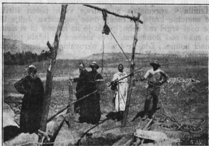
Vodnjak v afriškem misijonu.

Mnogo sta vedeli povedati o trudapolnem misijonskem življenju, kakor tudi o mnogih izpreobrnitvah. Dalo se je sklepati na mnoge žrtve, ki jih prenašate. Zlasti primanjkuje vode, tako da morajo z brozgo kuhati. Kako bi bilo treba sadovnjaka; toda brez vode ga ni mogoče obdelovati. Vprašale smo, če ne bi se dal izkopati vodnjak. Gotovo, in protestanti tudi vrtajo vodnjake, ker vlada daje na razpolago stroje za vrtanje. Toda tak vodnjak stane 200 angl. funtov, katere svote pa ne more naš misijon spraviti skupaj.