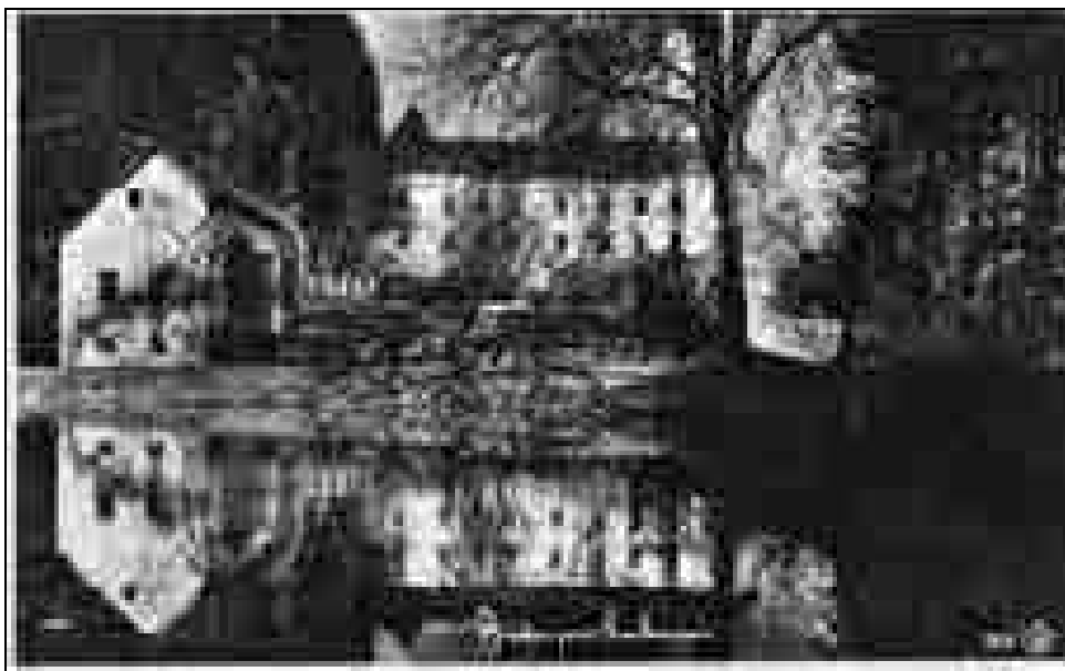
Grad Brdo pred drugo svetovno vojno.

Delo Janka Kersnika je pomembno ne samo za Slovenijo in Evropo, temveč tudi za razvoj slovenskega jezika, ki je najbolj dejavno potekal prav v njegovem času. Pomembna pa je tudi sama zgodovina gradu.