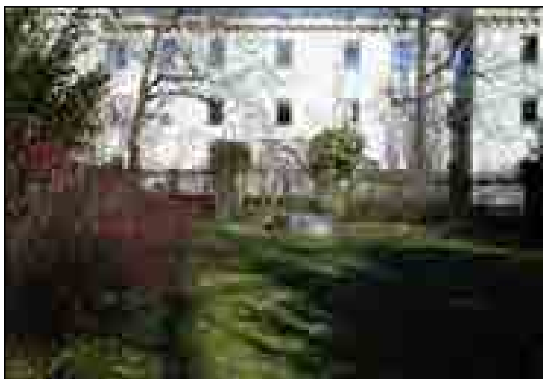
Današnji pogled na grad Brdo iz grajskega parka.

Načrtovana je podrobna predstavitev zgodovine gradu Brdo in (verjetno) tudi sosednjega gradu Kolvec, ki je zgodovinsko povezan z Brdom, delita pa si tudi podobni usodi. Pomembno pa bo tudi dopolnjevanje zbirke z izvirnimi teksti pisatelja Kersnika in drugimi grajskimi predmeti, ki se skrivajo v okolici.