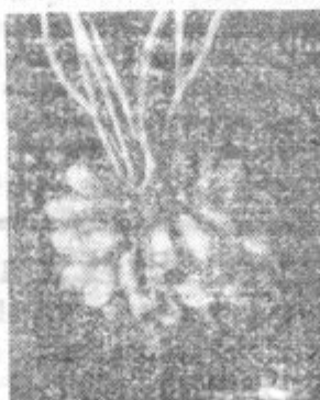
Težko sklenjena rast gomoljev. Slika zgoraj predstavlja vrsto «wekaragis», slika spodaj pa vrsto «zemsko zlato».

ki so še tu in tam na slabših krompirjevih sortah. Pozneje se je krompirjeva rastlina prilagodila podnebnju. Mnogo pa so pripomogli k temu izboljšanju umni kmetovalci, ki so odbirali razne boljše sorte in jih naprej gojili.