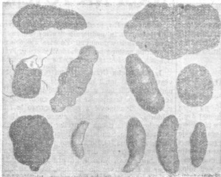
Oblika gomoljev pred 100 leti najbolj razširjenih krompirjevih vrst.

Kakor nam kaže slika, so bile oblike krompirjevih sort pred sto leti mnogo drugačnejše, kakor smo jih danes navajeni. Slika je vzeta iz poročila o krompirjevi razstavi v Altenburgu v Nemčiji leta 1819. To je bila prva večja krompirjeva razstava. Kakšna mešanica najrazličnejših sort je vladala takrat, nam priča dejstvo, da je bilo na tej razstavi nič manj kakor 6658 sort.