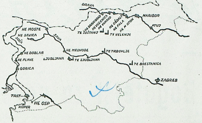
Energetski sistem LRS — hidro- in termoelektrarne, kakor so razmeščene po vsej Sloveniji. Nazorno je videti praznino na našem območju