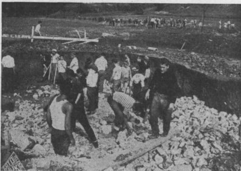
Polaganje kamena v dno bazena

Velenjčani, udeležujte se prostovoljnega dela