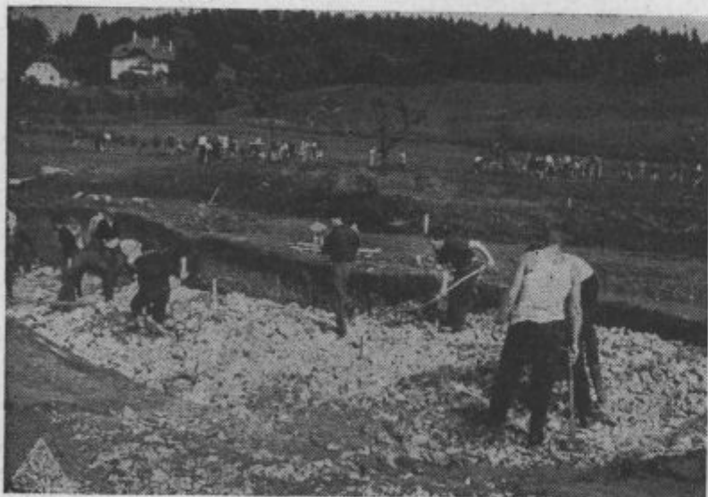
Prostovoljno delo na otroškem igrišču

Naše mesto je najmlajše in najlepše mesto rudarjev v Sloveniji.