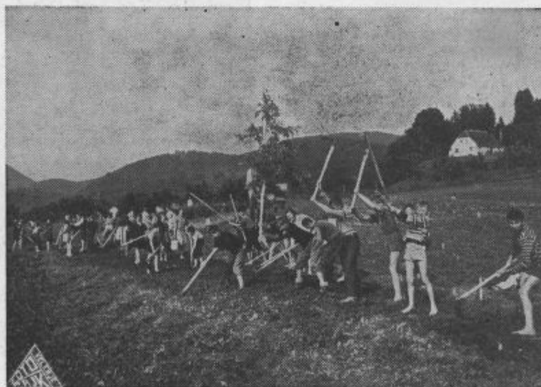
Tudi šolski otroci si urejajo igrišče

Stante Jolanda 2. a razred, Osnovna šola Miha Pintar-Toledo, Velenje