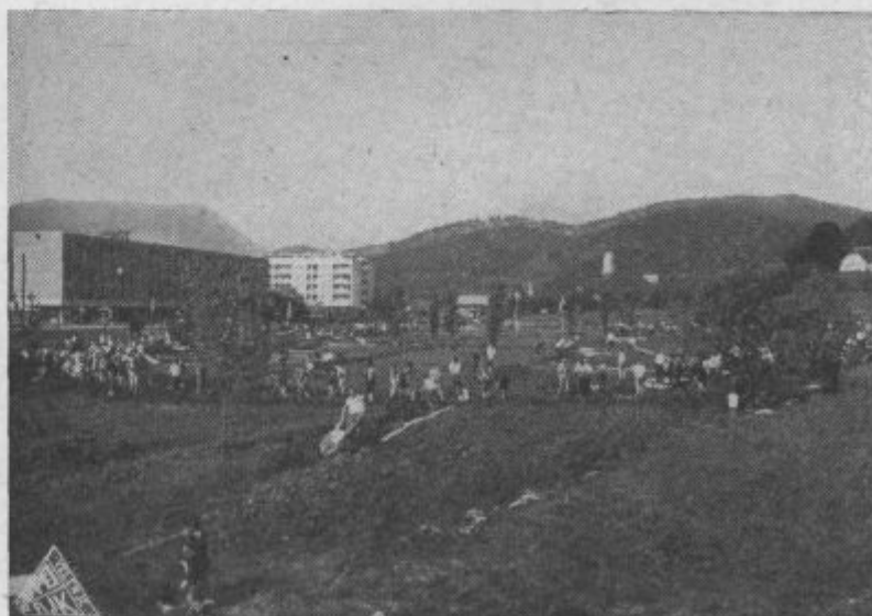
Pridni Velenjčani na otroškem igrišču