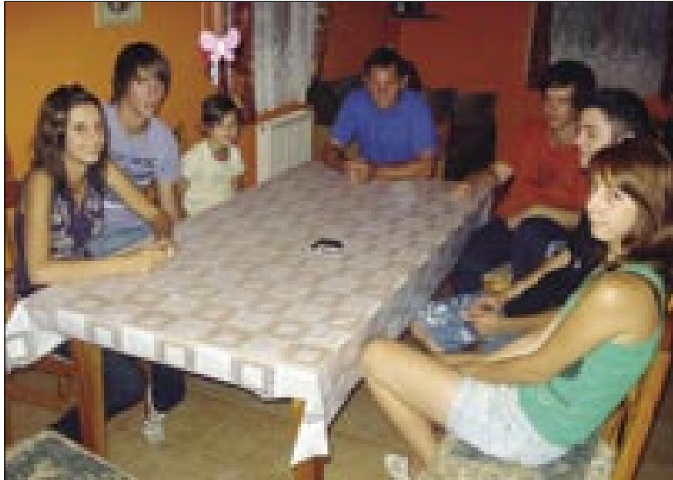
Držina je eške vekša te, gda deklina svoje pojbe tō domau pripelajo