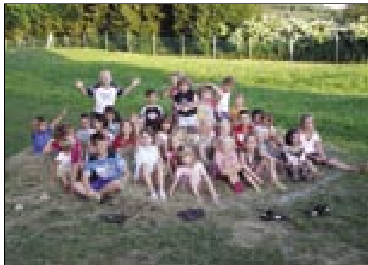
V Sakalovcih je veliko otrok

časa ostati. Tisti, ki se v lončarjenju niso hoteli preizkusiti, so se lahko lotili barvanja kamenčkov ali lova lesenih ribic iz banje. Programov pa ni bilo samo za otroke, organizatorji so pripravili igrivo tekmovanje tudi za starše