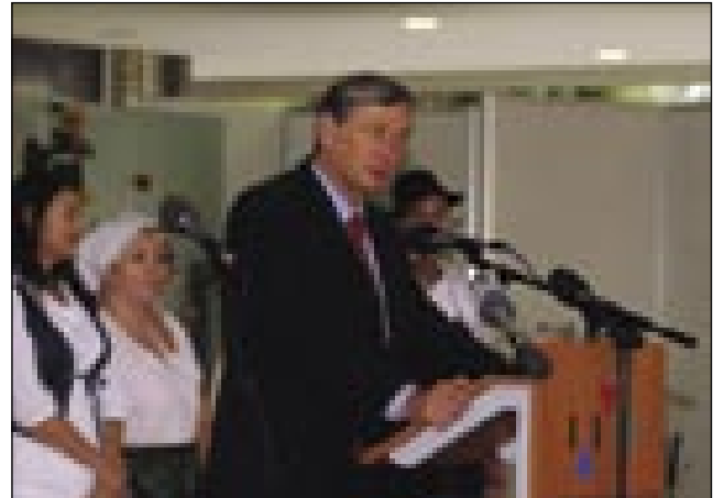
Predsednik R Slovenije Danilo Türk na otvoritvi sejma AGRA

»Resnično je velika čast, da so me povabili, da odprem 47. mednarodni kmetijsko-živilski sejem Agra v Gornji Radgoni, še posebno ker ta sejem nenehno raste,« je ob odprtju največje sejemske prireditve v Pomurju poudaril predsednik države dr. Danilo Türk, ki je sejem tudi uradno odprl.