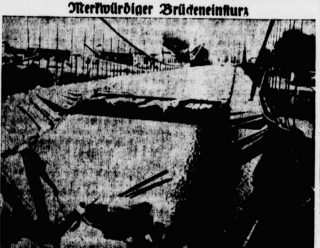
Die Hängebrücke ist unter der Last eines schweren Kraftwagens eingetrückt. Der Chauffeur kam mit dem Schaden davon.

In Dorfe Zeece in Albanien knappt an der jugoslawischen Grenze trug sich Montag vormittag eine grauenhafte Familientragödie zu. Der reichste Bauer des Ortes hatte, da er Arbeiter zu verpflegen hatte, drei mit dem sein Vater die Lämmer geschlachteten Lämmer für das Mittagessen geschlachtete. Bei dieser Tätigkeit hatte ihm sein Stähriger Sohn zugehauen. Als der Vater nachher aufs Feld ging, um die Arbeiter zu beaufsichtigen, nahm der Kleine das Messer, hatte, und schlachtete damit seinen einjährigen Bruder in der Wiege ab. Dann begab er sich zu seinem Vater auf das Feld und, als er sah, was der Knabe angeestellt hatte, packte er ihn am Hals und erwürgte ihn. Da kam die Mutter nach Hause und fiel, als sie ihre beiden Kinder tot sah, in Ohnmacht, der Bauer aber sprang in seiner Verzweiflung in den Brunnen und ertrank. Der Fall wurde im Dorfe rasch bekannt und