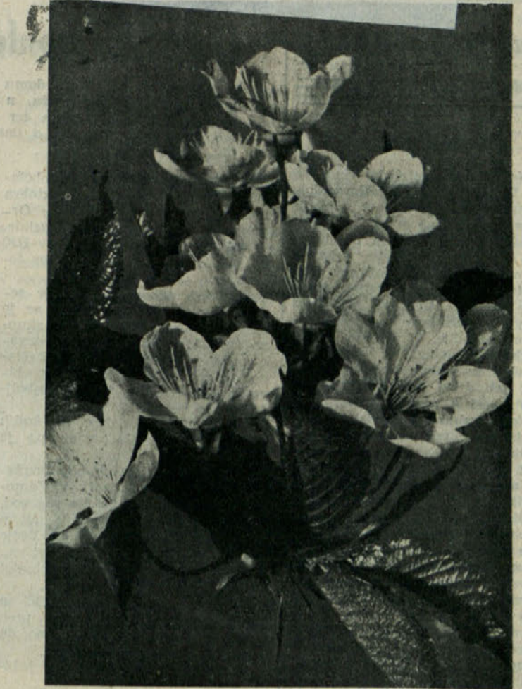
Teloh — znanlec pomladi!

10 odst. članstva ZB bo anketiranih. Podatki te ankete bodo dali sliko, v kakšnih pogojih delajo in žive bivši borci.