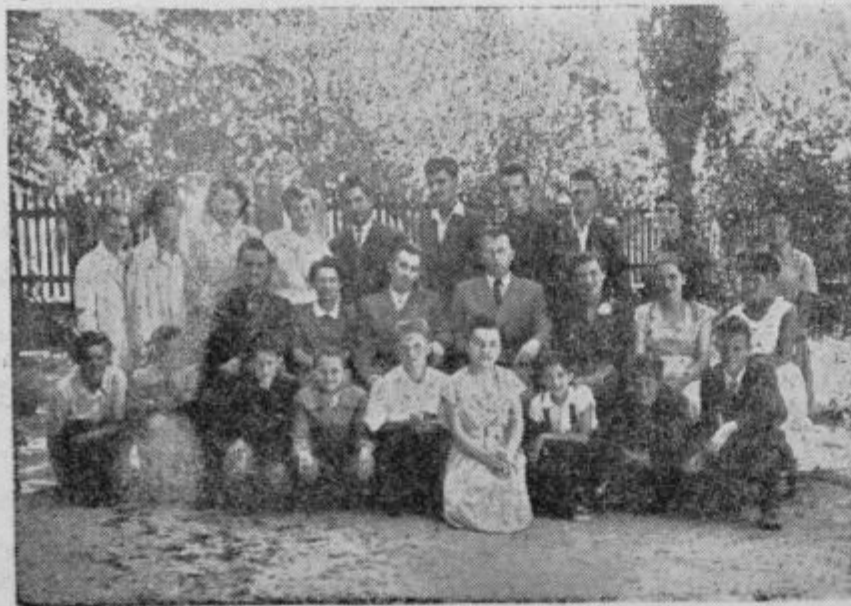
Bosančki šoštanjkega okraja pred odhodom v svoje rojstne kraje