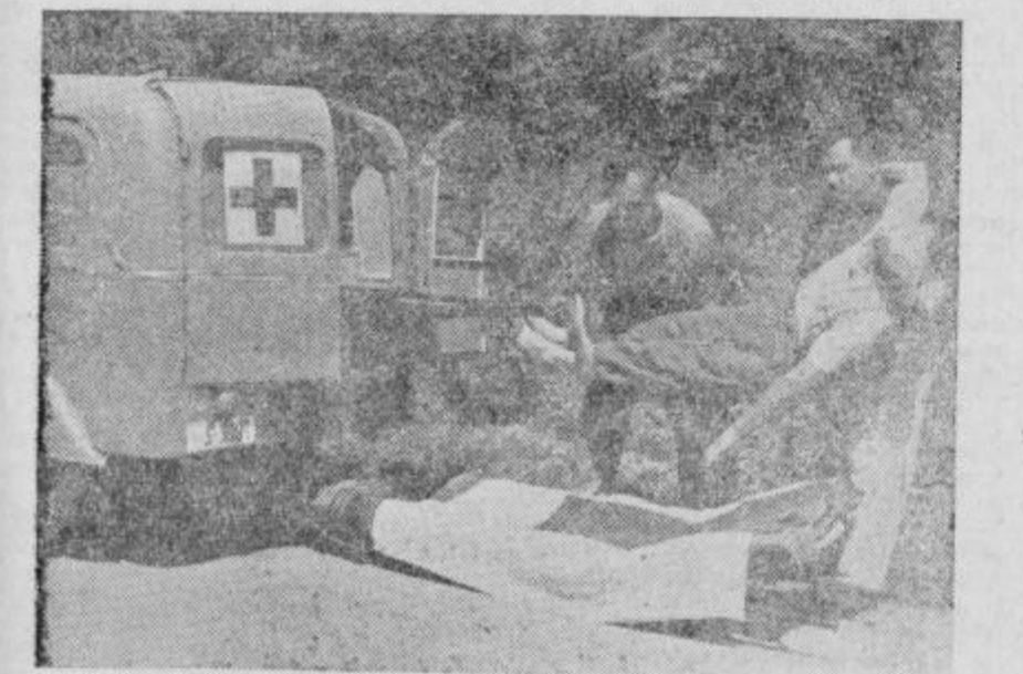
Vedno pripravljeni pomagati soljudem v nesreči

mesto v delovanju RK. Mnogoštevilni tečaji za žensko mladino bodo brez dvoma imeli pozitivne rezultate in vplivali v splošnem na zdravstveno prosveto na vasi.