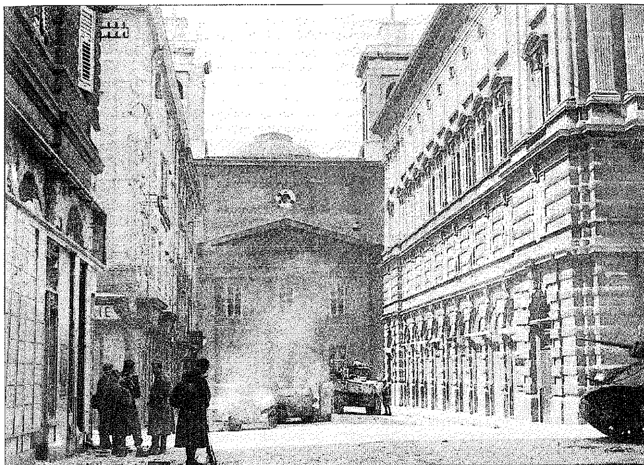
Prizori iz jugoslovanskega Trsta. (NŠK). Momenti della Trieste Jugoslava.

vica narodov do združevanja v eni državi, lahko prištejemo še poziv CK KPS iz leta 1941 ter deklaracijo Izvršnega odbora OF iz oktobra 1942, ki razglša, da je slovenska vojska združila narod od Špilja do Trsta in od Velikovca do Kolpe.