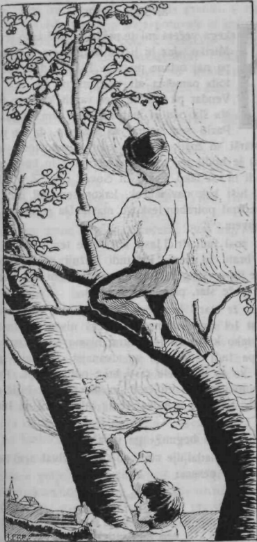
◁ Po črešnje! ▷