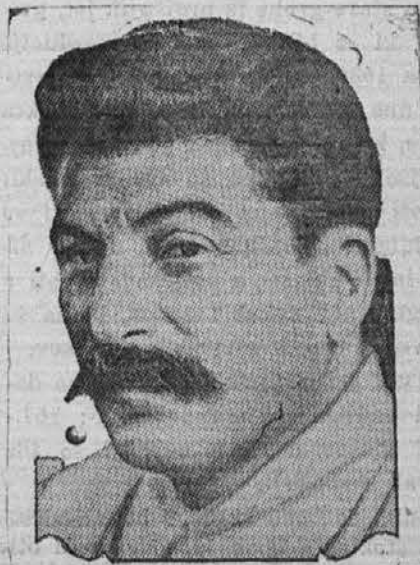
Vodja Rusije, Stálin

Francoski senat je tudi že odobril pogodbo z Rusijo, in sicer z veliko večino.