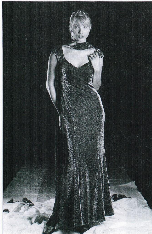
Eden mnogih modelov svečanih oblek, izdelek Evexa.

(Ko potem doma pripovedujem ženi o bogatem programu Evexa, ugotovim, da ga ona že od poletja dodobra pozna, in mi hiti kazati, da že premoremo blazino-odejo; celo pogrnjena je čez posteljo. Tako je blagovna znamka prišla, ne da bi jo niti opazil, celo na mojo posteljo. Kaj ne bi šle torej mimo mene, denimo, večerne ali celo poročne obleke, pa čeprav sem se ob obisku v Evexu sprehajal med njimi! Žena mi ob pripovedovanju kar ne more prehvaliti prijavnosti prodajalk v trgovini Loka, saj so jo znale prepričati glede uporabnosti blazine-odeje. Pa ne samo nje. In če boste iskali darila za novoporočence ali za koga drugega, vas bodo gotovo znali prepričati o odličnosti svojega proizvodnega programa.)