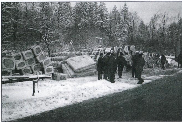
Izolacija Novoterm za zmanjšanje toplotnih izgub med dolgo logaško ogrevalno sezono

Bojan Žnidaršič, dika Energetski svetovalec