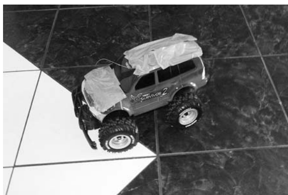
Fotografija 2: Matevžev džip (Matevž, 15. junij 2011)