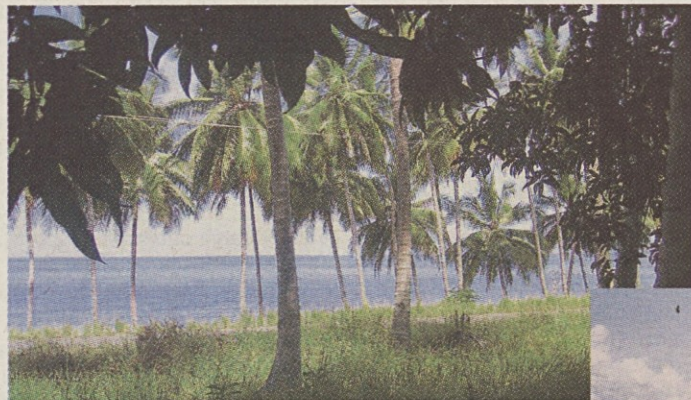
Plantaza kokosovih palm, v ozadju Tominsko morje.

novembru ni neviht in neurij, ne večjih valov, pojavljajo se le manjše plohe oziroma tropski nalivi. Med plovbo do otočka Bolelangan smo se ustavili ob koralnem grebenu blizu otoka Tanpan, z maskami skočili v morje ter si ogledovali čudovit svet koral in pisanih ribic ob njem: nekatere se lovijo, druge plešejo, da je veselje. Ko smo se odpravili do naslednjega koralnega grebena, je posadka barkače ujela skoraj meter dolgo tuno. Bilo je vriska, da je kaj. Okoli poldneva so nas na barkači pogostili s pečenimi ribami, jetrci ulovljene tune, rižem, malancani v kokosovem mleku in tropskim sadjem. Naročili smo tudi mrzlo pivo Bintang ali hladno stekleničeno vodo, kar je bilo v vročem morskem okolju pravo razkošje. Za kuhinjo je na barkači skrbel prikupni in precej odebeleni mister Big.