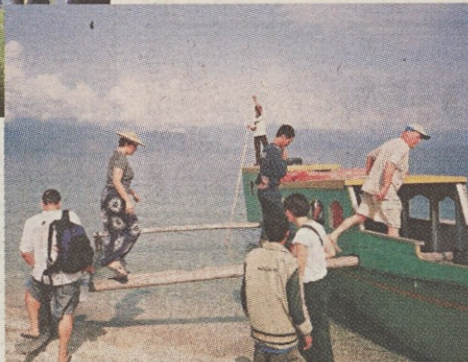
Z barkačo bomo zapluli po jezeru Poso.

benec v Jakarti, glavnem mestu Indonezije, ob njem sta tudi hčerki študentki. Upravljalci otoka nam znajo pričarati prav prijetno vzdušje. Sicer pa vstajamo z dnevom in si še pred zajtrkom privoščimo »namakanje« v morju. Ob 9. uri pride navadno po nas barkača, da nas popelje nad koralne grebene ali v neokrnjen zalivček kakšnega otoka. Morje je v tem času povetlično mirno, voda čista, tako da z masko lahko neovirano opazujemo lepote koralnega grebena in življenje ob njem. Nad koralami je voda tako čista, da jih lahko slikamo celo z barkače. Povzpeli smo se tudi na manjši atol-pokopališče ko-