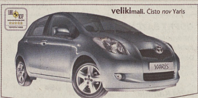
velikimali. Čisto nov Yaris

Pooblaščen zastopnik družbe Mobitel d.d.