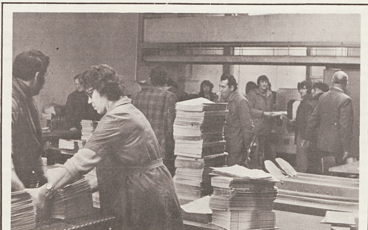
Prostorski problemi Dnevnikovih odpremnih oddelkov ostajajo vse leto nespremenjeni. V premajhnem prostoru, kjer delata dva oddelka, je poleg redno zaposlenih še kopica raznašalcev, katerih prostor je spremenjen v skladišče. Tak prizor ob dopoldnevih je običajen

Na nas vseh je uspešno uresničevanje začrtanih nalog. Sprejemamo namreč tudi vsak del odgovornosti za uspešno delovanje in izgrajevanje samoupravne družbe, ki jo sestavljamo vsi. Doslej smo zbrali že kar precej vprašanj in pripomb, sprašujemo se o marsičem v zvezi z delovanjem delegacij in zborov, analiziramo svoje delo, to pa je vsekakor dober začetek in obet za naprej.