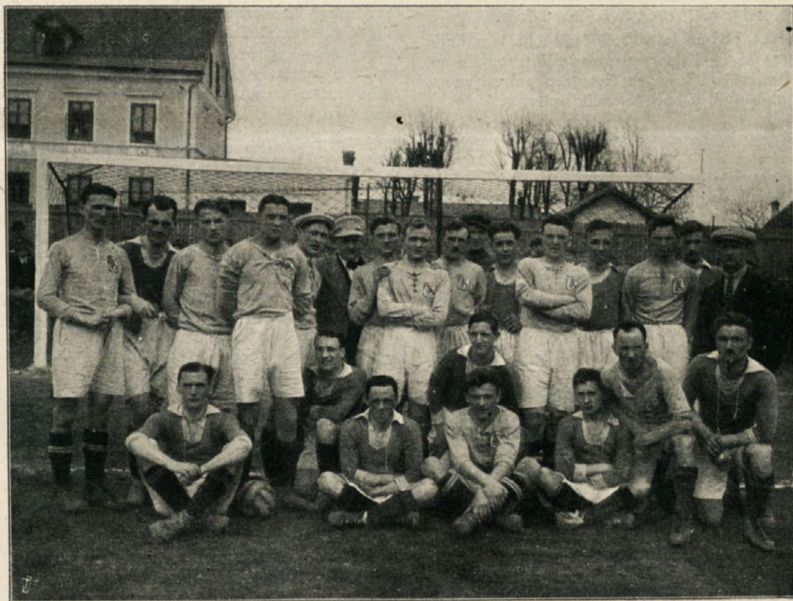
Moštvo Gradjanskega Š. K. in S. K. Ilirije.

samostojnih novih organizacijah. Že dobro razvite panoge sporta je zblíževala v svojih odsekih, ki so se ob zadostnem razmahu pretvorili v podsavez saveza dotične panoge sporta. Tako imamo danes nogomet in kolesarstvo že v savezih, atletika in vodni sport sta pa na tem, da se osnujejo podsavezi.