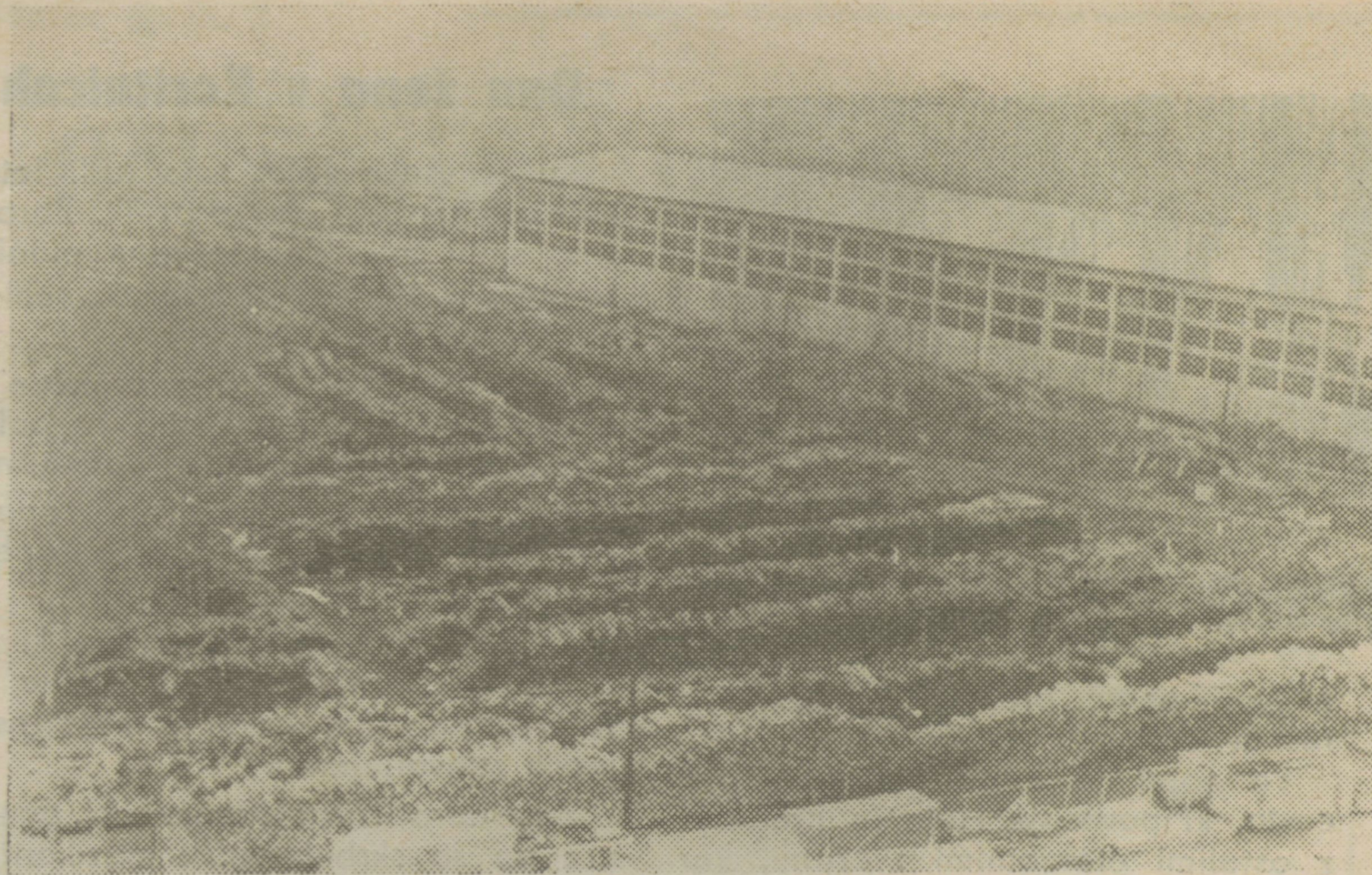
Novo skladišče gotovih izdelkov in skladišče surovin v Lesonitu