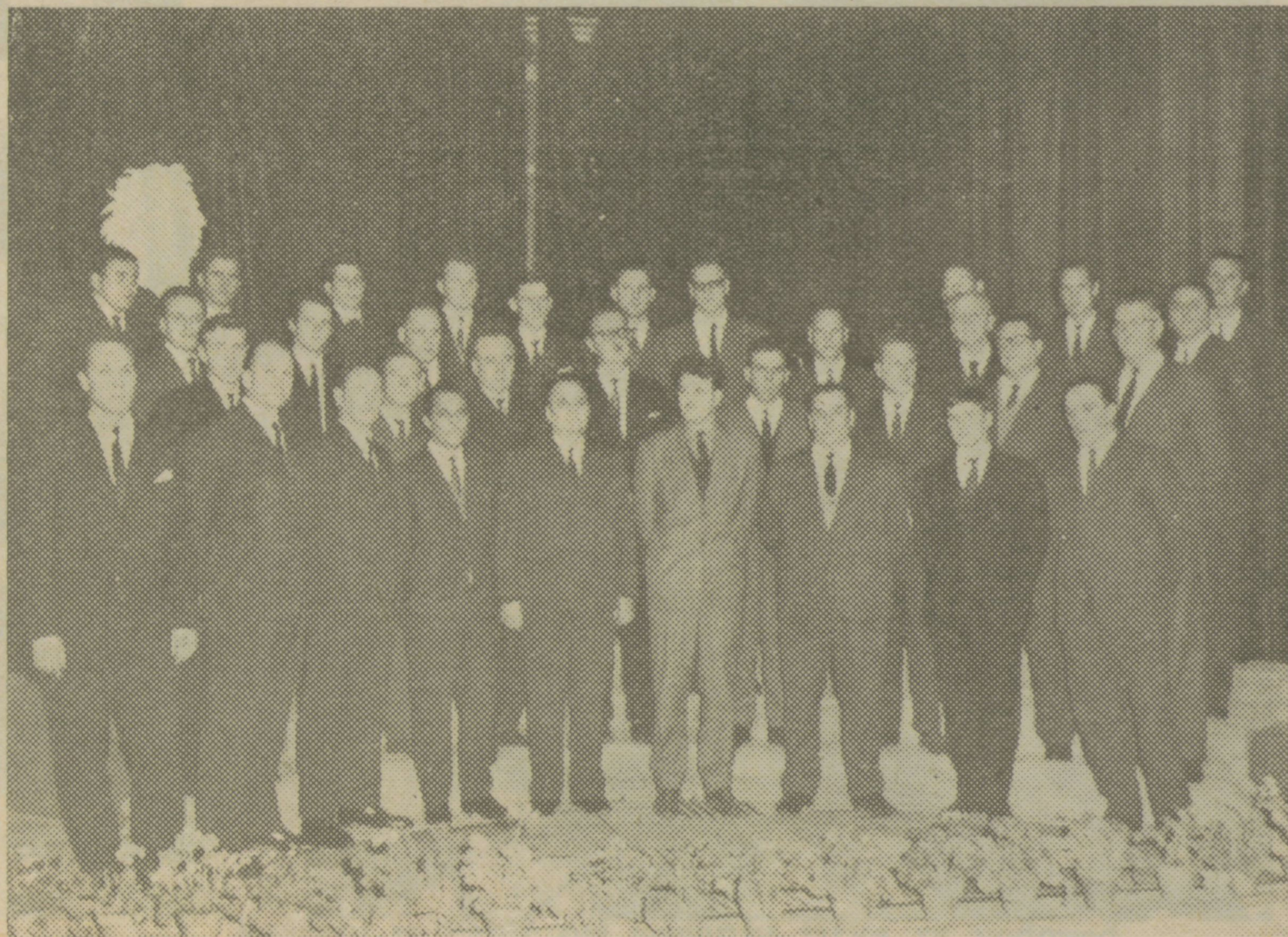
Obnovljeni moški pevski zbor je pel na Prešernovi proslavi

Lepe misli in lepi načrti našega moškega zbora! Če naj omenim mimogrede, da je naš zbor razen ajdovskega edini večji in resnejši pevski zbor na Primorskem, bi bilo morda le nujno razmisliti, kako mu zagotoviti vsaj najnujnejša sredstva za uresničitev programa.