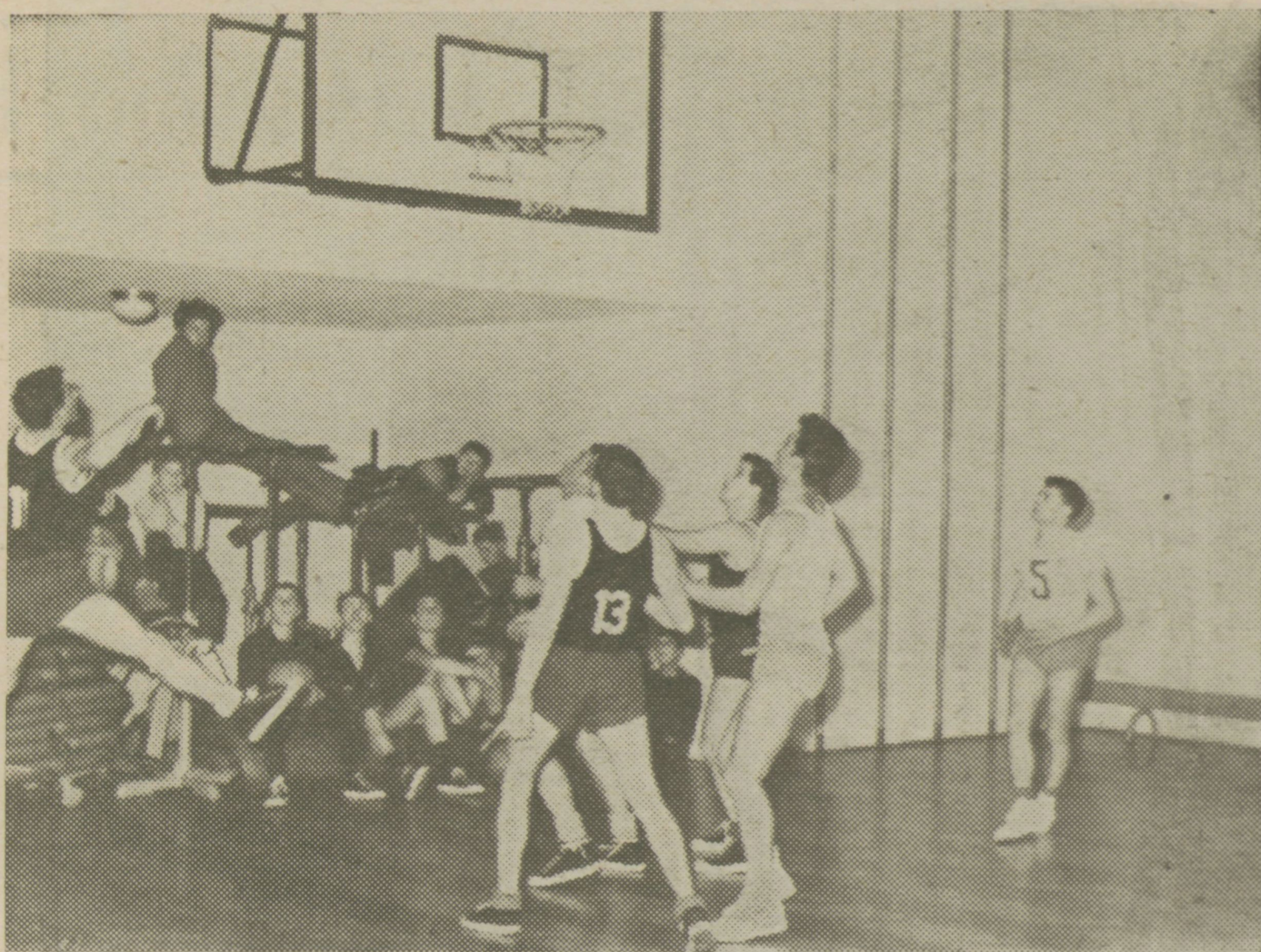
Prizor s tekme Lesonit—Sežana, dne 23. februarja 1966

Na svidenje 27. aprila na košarkarskem igrišču!