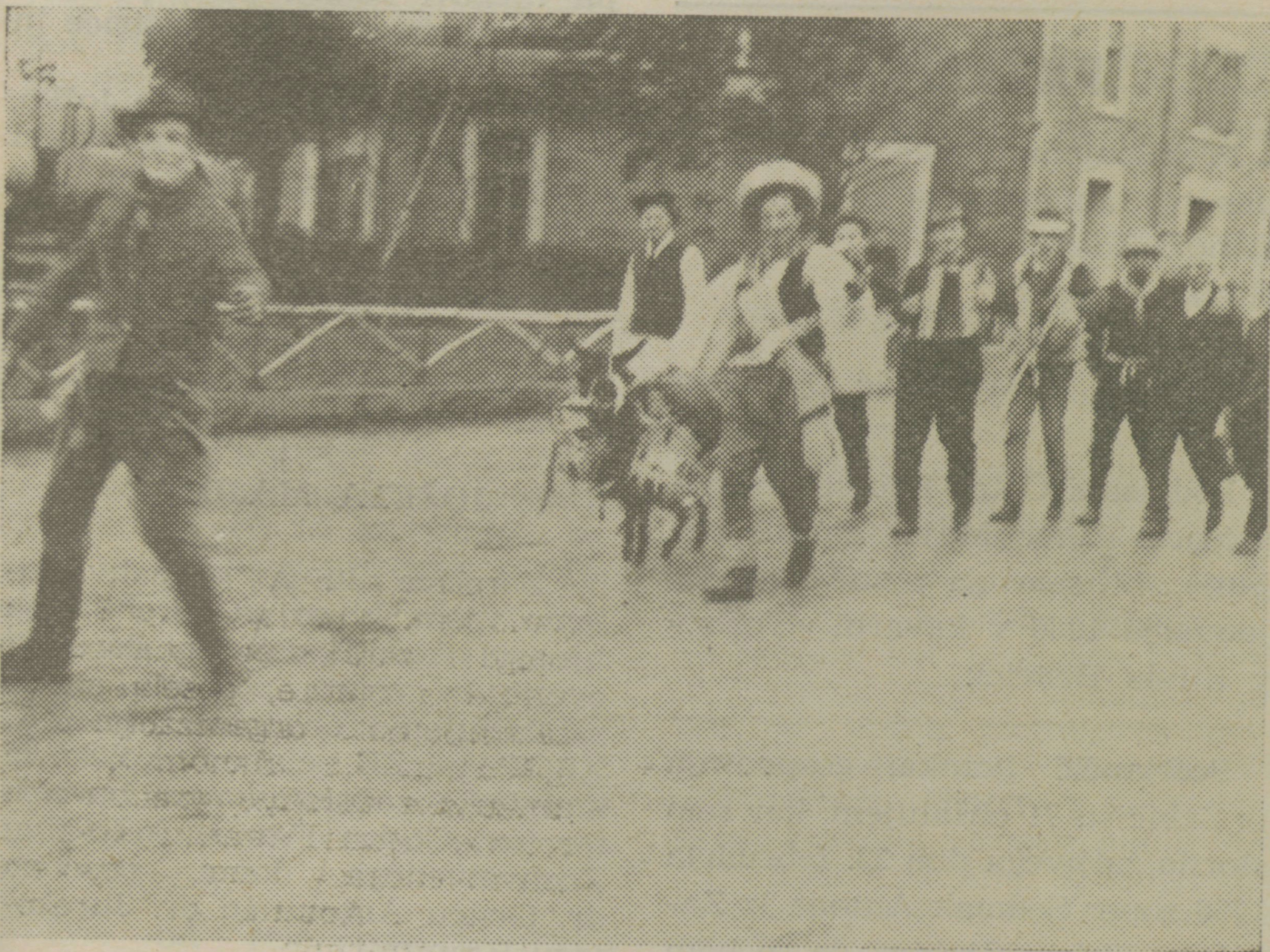
V sprevedu pustnih maškar stopa osliček, natovorjen s klobasami in jajci

Na pustno nedeljo dirjamo vsi v Matulje občudovat pustne norčije.