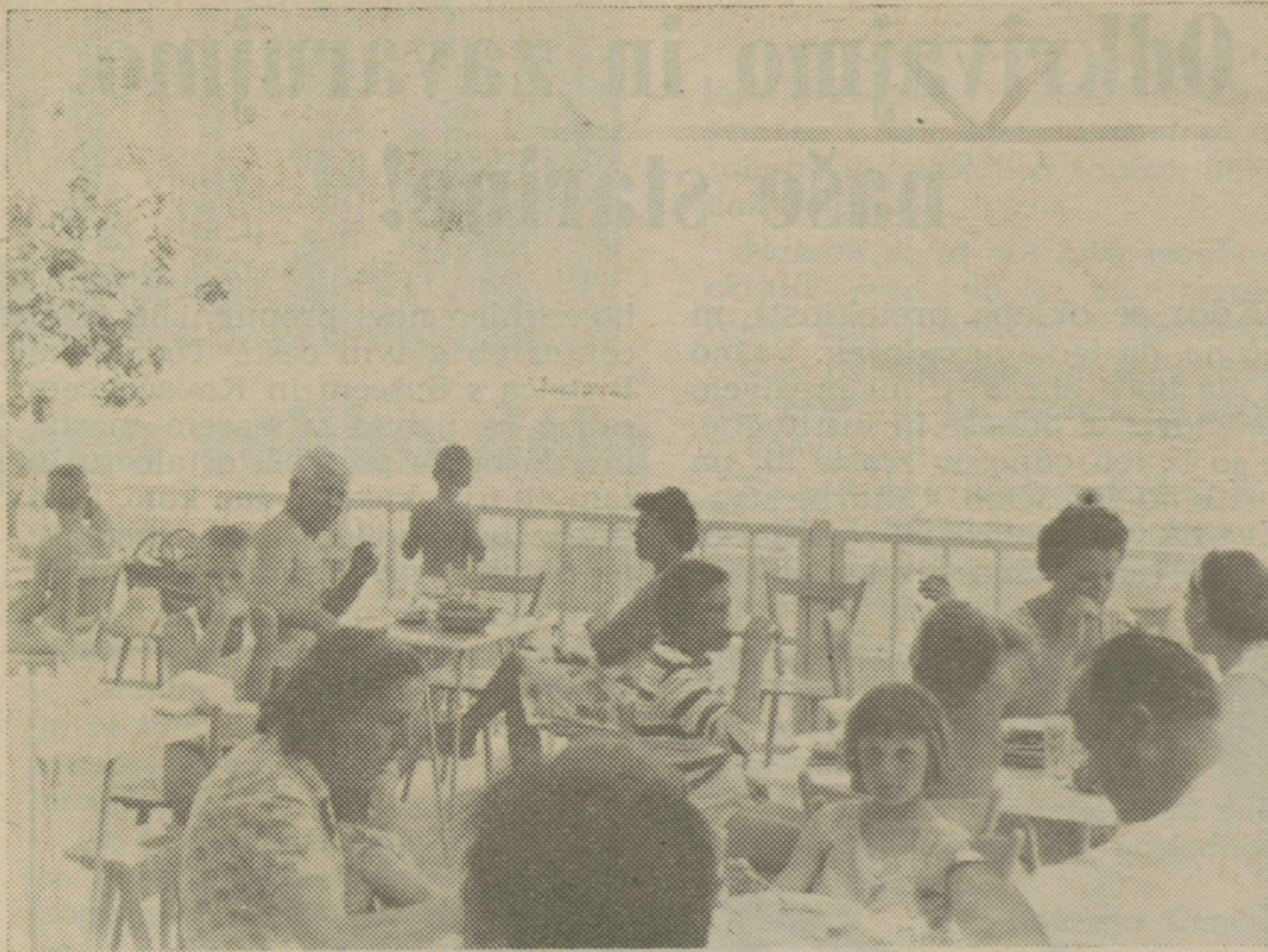
Terasa počitniškega doma Lesonita v Mošeniški Dragi

In čemu so namenjena ta sredstva? Oddihu, aktivni rekreaciji delavcev. Toda ali je kopanje in počivanje v domu edina rekreacija? Kdo si upa določiti vsakemu posamezniku obliko njegove rekreacije? Kaj izhaja iz tega? Del sredstev za rekreacijo, del reresa bi naj dobil sleherni član kolektiva ne glede na to, kje je na dopustu in če sploh je na »dopustu«. V tem primeru pa je res stvar vsakega posameznega kolektiva, da razmisli o tem, kako in koga bo regresiral, kolikova bo višina regresa in ne nazadnje, kak-