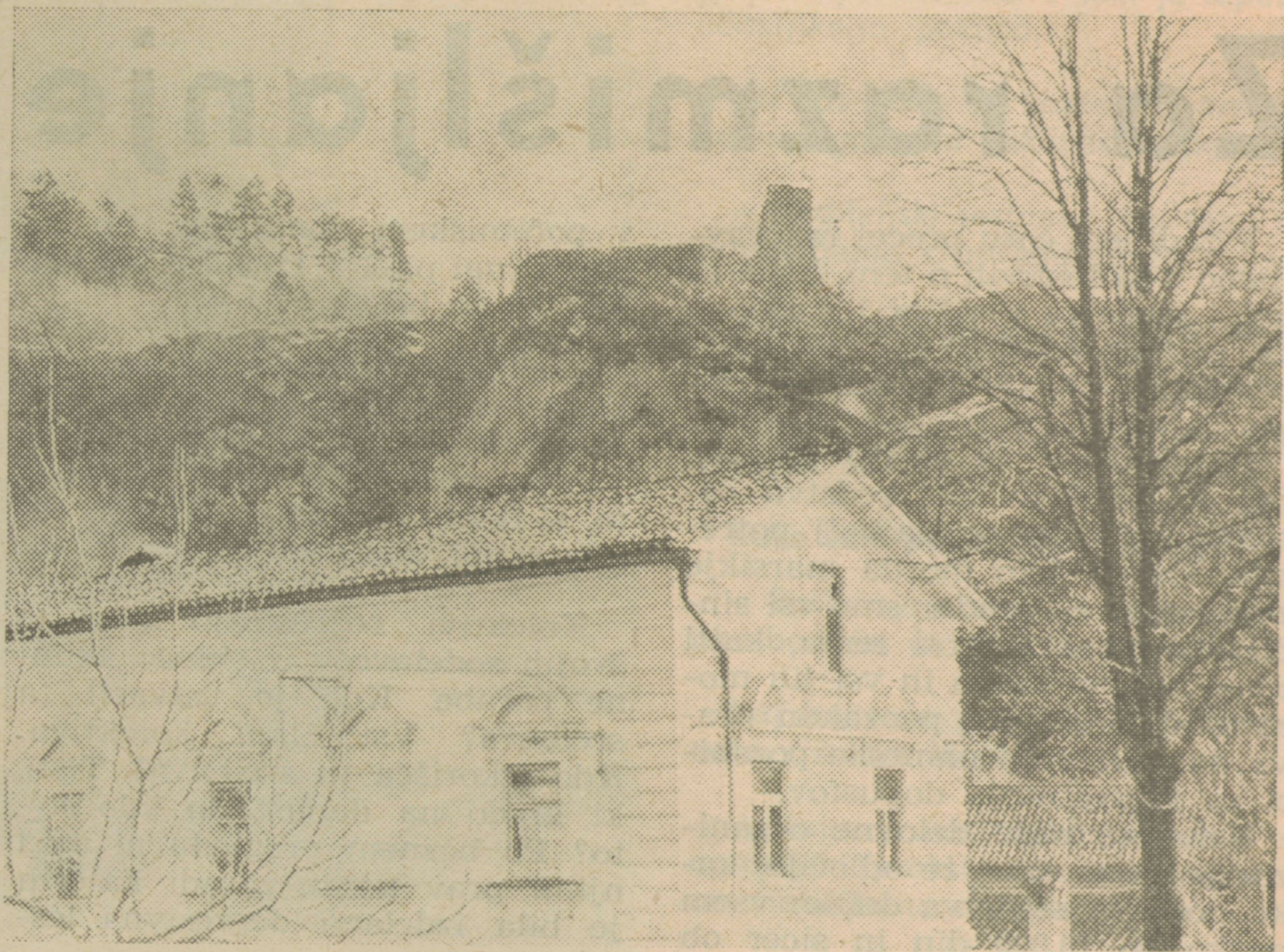
Stara Bistrica — pogled na Gradin

moramo zamisliti. Je že tako, vsak stremi k napredku, nihče noče za razvojem zaostajati. Velika okna, balkoni in terase so zelo vabljivi za tiste, ki gledajo v svet še vedno