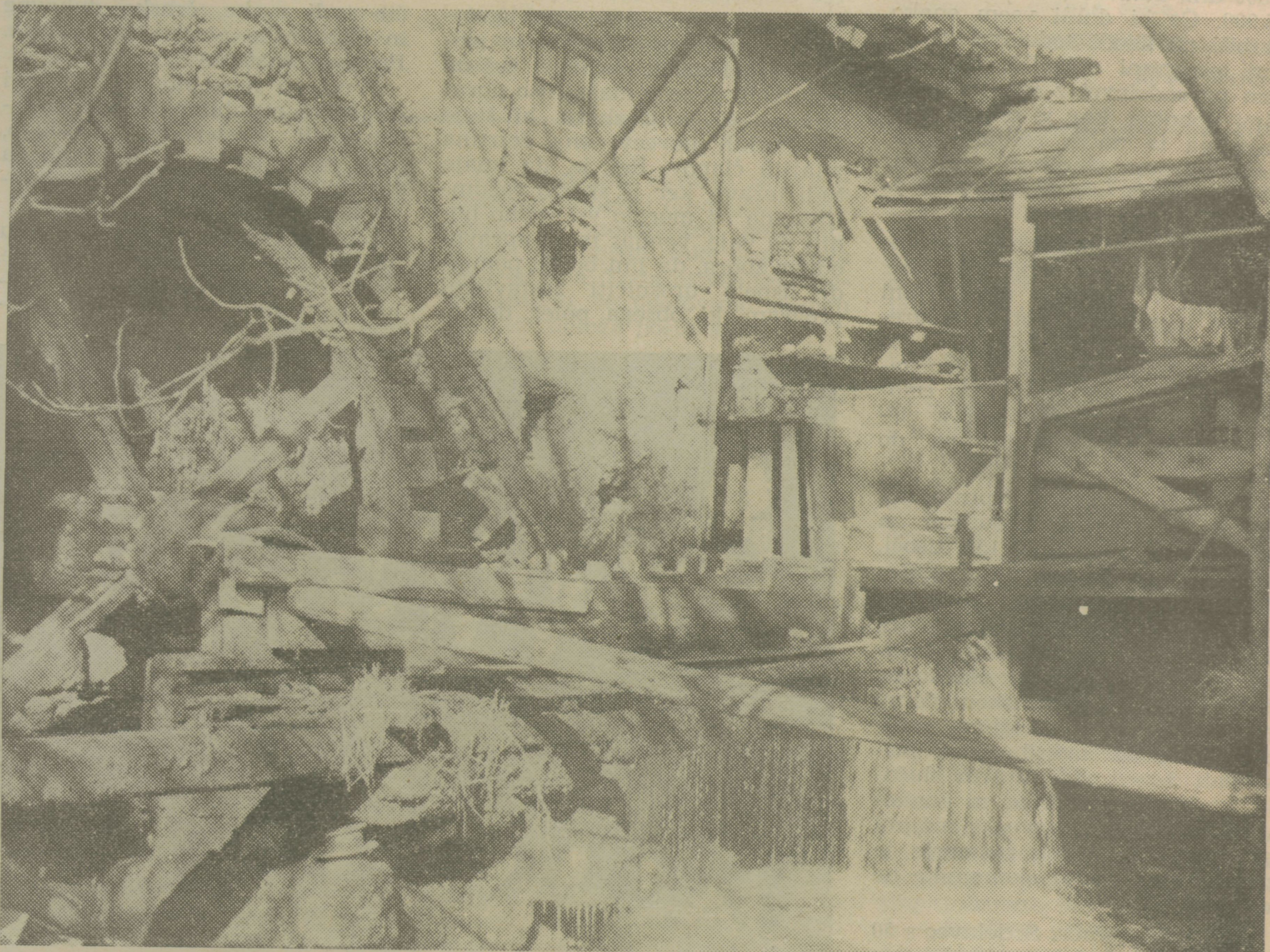
Lep motiv iz Bistrice, če ...

Mogoče bo kdo mnenja, da tiste navlake in podrtije v Sibiriji res ni potrebno zaščititi. Res je, v letih in desetletjih so se hiše ob bistri vodi obdale s tolikimi prizidki, drvarnicami, kurniki, pristreški, plotovi in podobnim, da so vse prej kot zanimive. Veščak pa bo kaj kmalu odkril za to šaro pristno in skladno linijo stare arhitekture in ko bo odstranil vso navlako, bo v malenkostnih konzervatorskih in restavratorskih posegih zaživela pred nami resnična podoba naše stare Bistrice. Potem bo sprenhod ob bistri vodi resničen užitek za domačine in za tujce in kozarec pristne kapljice v lokalu, bo neprimerno bolj teknil, kakor v modernem lokalu, ki diha sicer svetlobo, toda tudi hlad. M.