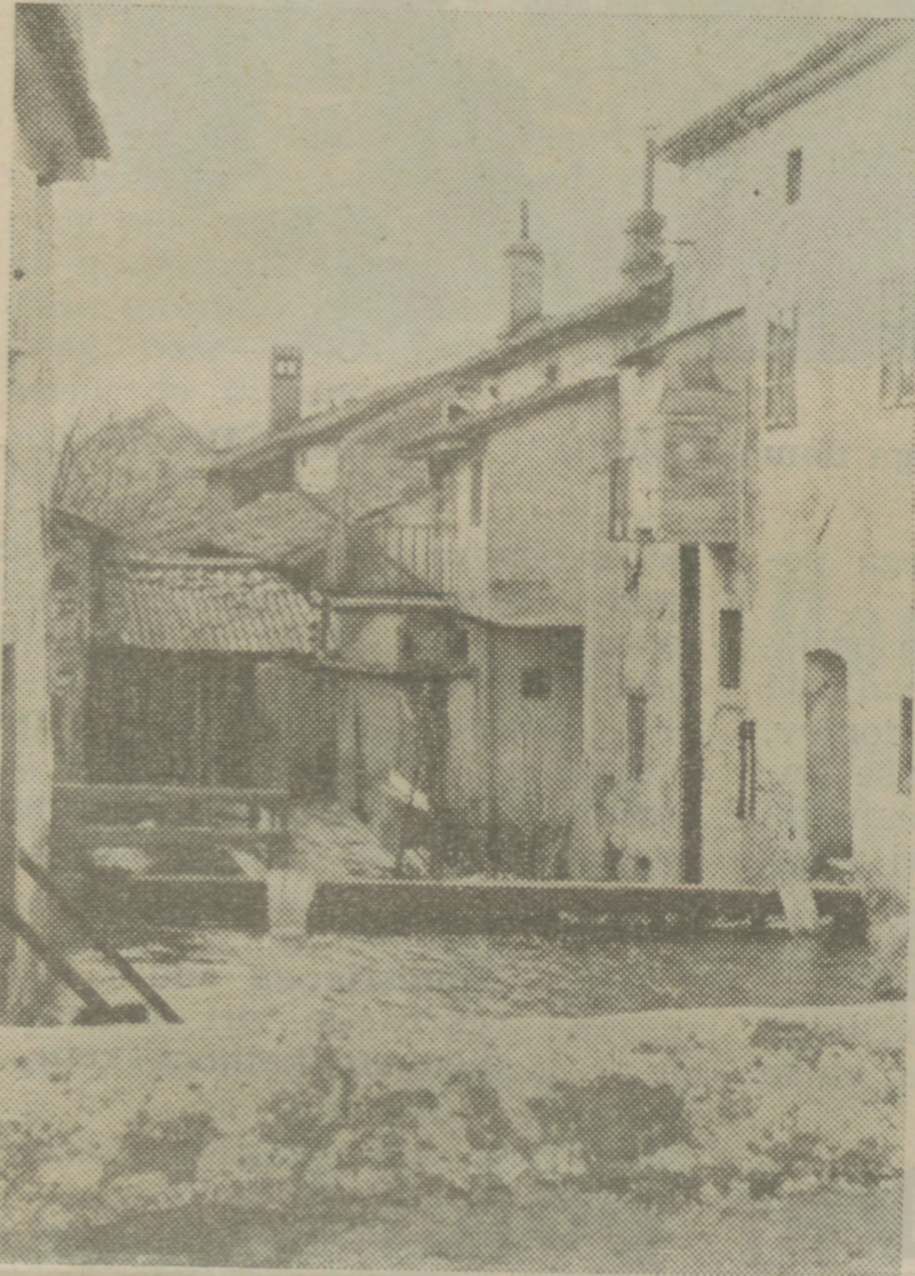
Motiv iz Sibirije

bo zgrajen novi prometni in tržni center ob glavni cesti. Toda reka Bistrica s Sušcem in Kovačevcem se bo še penila v starem mestu, morda bo še po sreči ostalo tu in tam ob njih kako vodno kolo, toda ljudje bodo v tem delu mesta še prebivali. Prav zaradi teh ljudi se