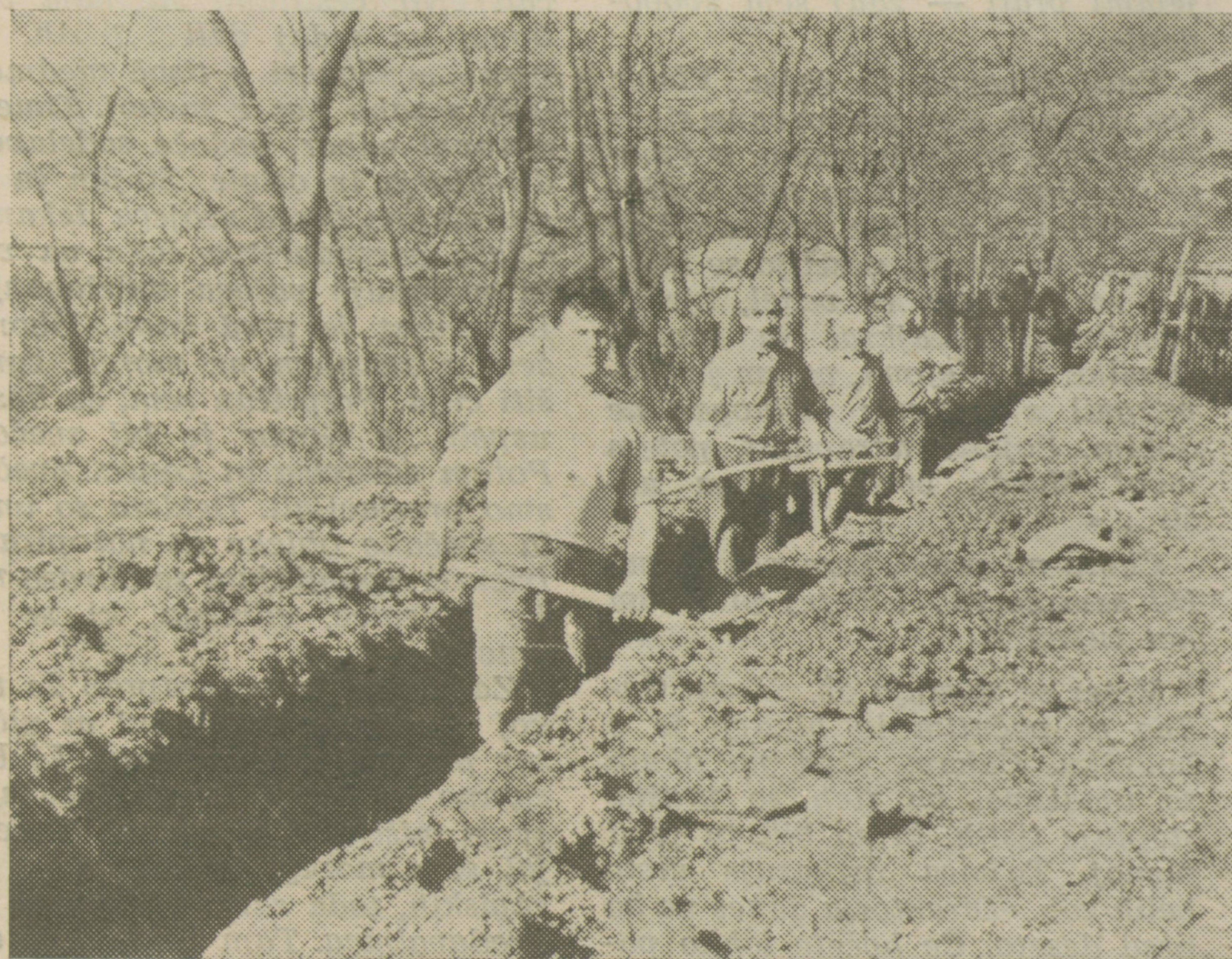
Vaščani iz Zabič pri kopanju jarka za vodovod

Ta sklep so vaščani Zabič sami predložili, zato je prav gotovo, da ga bodo tudi dosledno izvrševali. Dela so se že začela in bodo zaključena že v tej spomladi. T. G.