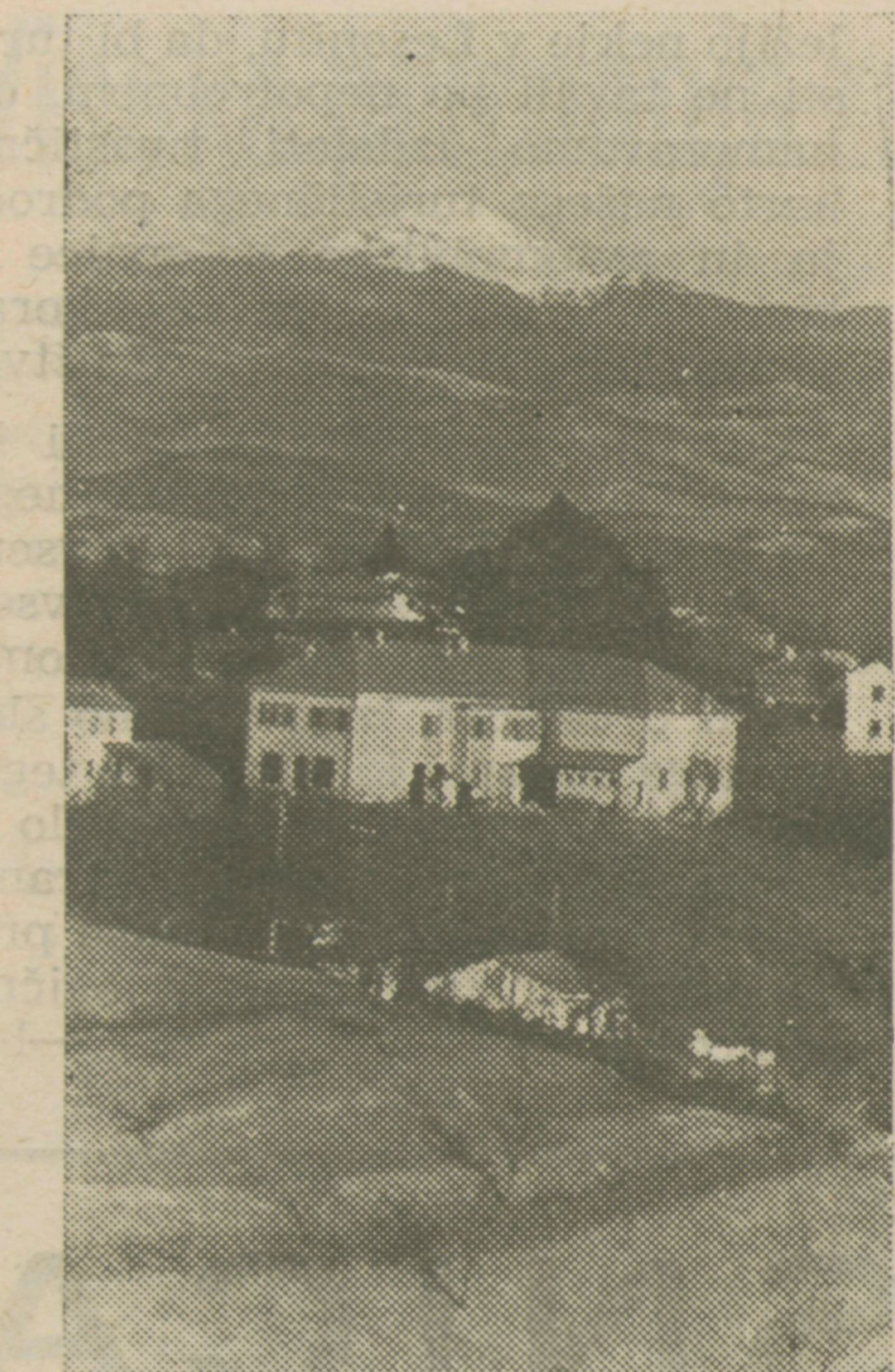
Pregarje — največja brkinska vas in Snežnik — dva simbola naše domačije

Odgovor uredništva: Na matičnem uradu, kjer smo dobivali prej podatke o rojstvih, porokah in smrtih, pravijo, da notranja uprava teh podatkov ne dovoli objaviti brez pristanka prizadetih državljanov, ker nekateri ljudje ne marajo, da bi se njih ime natisnilo v časopisu. Skušali bomo ustreči vam in še neštetim bralcem tako, da bomo dobili privolitve prizadetih državljanov; upamo, da nam bo uspelo. Prejmite vi in drugi rojaki prav lepe pozdrave in se še kaj oglasite!