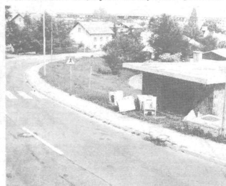
Ob cesti, ki se s Celovške vzpenja proti Pržanu, bo nekoč ali pa vsaj v bližnji prihodnosti servis pralnih strojev. Stranke opozarjamo, da pri naši birokraciji ni mogoče dobiti dovoljenja za tako obrt tako hitro in, da naj s svojimi odsluženimi gospodinjstvi aparati še malo počakajo. Če smo se zmotili, upamo da bodo z dobro voljo lastnika in komunale kmalu tam, kjer je prostor za tovrstne bisere bele tehnike.