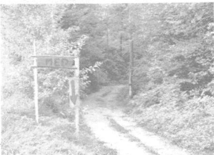
Nad gramoznico v Podutiku, kjer bodo čez mnogo let kraljevale skalalnice vodi romantična pot v gozdček. Na odcepu stoji opozorilo ali pa obvestilo na katerem piše »MED« in puščica, ki kaže v tla. Očitno se nam bo cedit med šele dva metra pod zemljo!