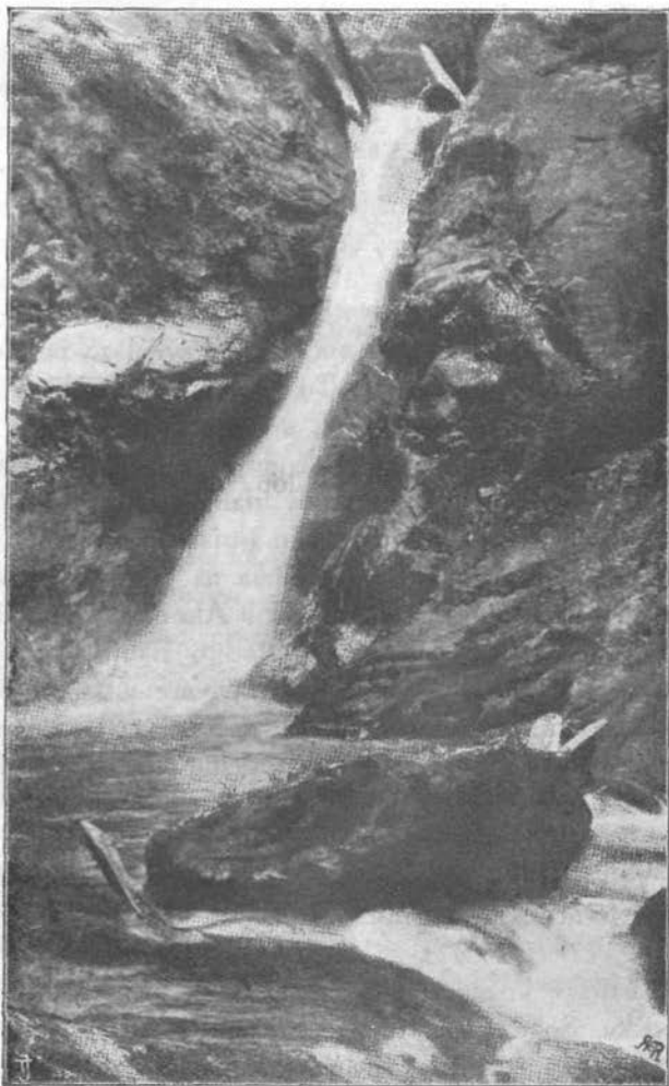
Pohorje: Mali Šumik, slap Lobnice.

Dal sem si skuhati žgancev, in skuhalo so se „žganci.“ Ne rečem,