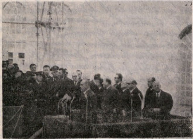
Ob priliki splavitve ladje «Raffaello» so komunisti ladjedelnice Sv. Marka naslovili ministru Bo vprašanje, ali namerava vlada sprejeti primerne ukrepe za potenciranje ladjedelnice Sv. Marka in za zagotovitev kontinuitete dela, toda do danes niso prejeli še nobenega odgovora. (Na gornji sliki: minister Bo med govorom ob priliki splavitve ladje «Raffaello»).

— tržaška luka zelo občuti pomanjkanje trgovinskih sporazumov z deželami Srednje Evrope, zmanjšanje šte-