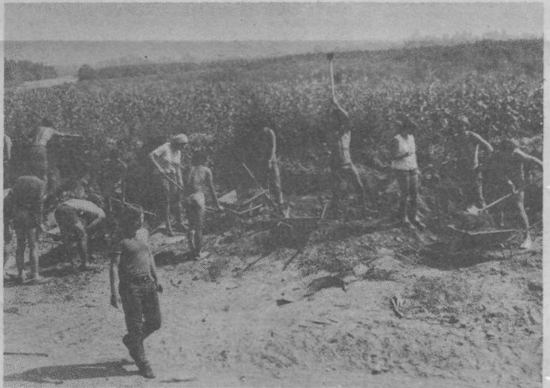
Ljubljanska mladinska delovna brigada „Tone Tomšič“ je bila na delovni akciji Sava 73 sicer maloštevilna vendar si je priborila lepo število pohval in priznanj

In rezultat? Led smo prebili, vendar je zeleti, da v prihodnjih počitnicah pride še več otrok v našo počitniško varstvo in že sedaj apeliramo na starše, ki niso prosti kakor njihovi otroci, da jih julija in avgusta 1974 pošljejo v poletno varstvo.