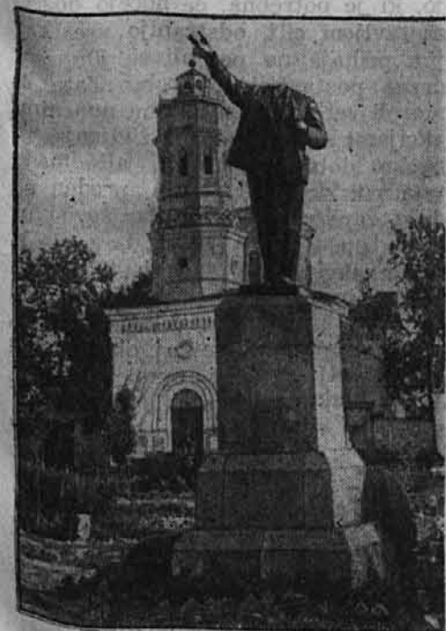
Brezglavnost — simbol boljševiškega propada. Povesod srečavamo take razbite predhodnike propada.

Helsinki, 22. avgusta. Kakor poroča sovjetska poročevalna služba, so našli v Stahanovotempu podzemeljsko varstveno klet; imenuje se »Stalinova palača«. V tej kleti se bo vršila konferenca treh sil. Palača je varna pred bombami in plini in se imenuje kot najvarnejši prostor sveta. Stalin si je palačo že osvojil, ker so Kremelj nemške bombe hudo razdejale.