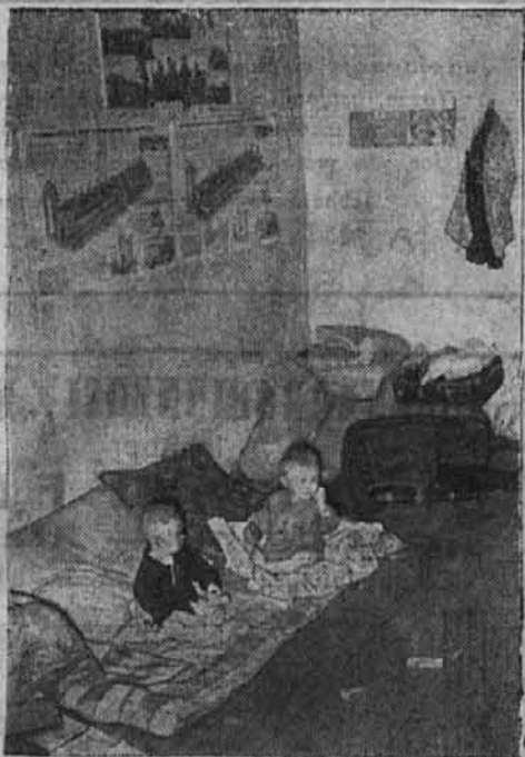
Stanovanjska kultura v „sovjetskem paradizu“

Agram. V poteku je program začetka gradbe cest vzhodno-zahodne osi Agram—Semlin. Poglavniki dr. Ante Pavelić je dal na razpolago potrebne vsote. Stroški za to progo bodo znašali 4 milijarde kun.