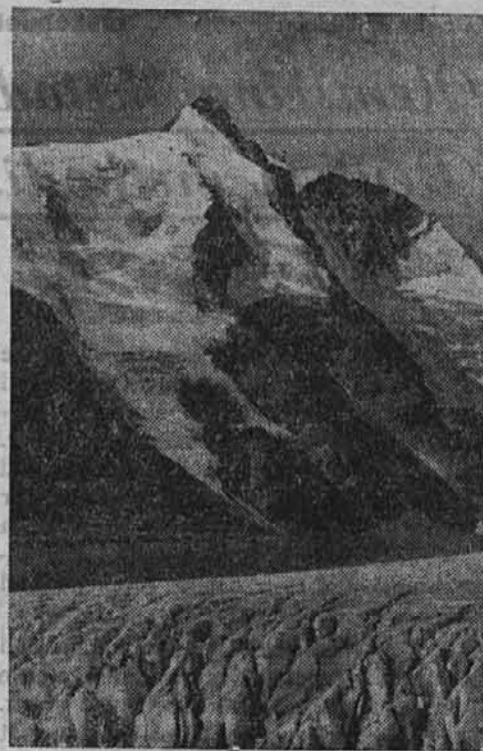
Največja gora Velike Nemčije. Naša slika nam kaže kralja nemških gora, 3798 m visokega Grossglocknerja (Veliki Klek), kateri je ponos koroške pokrajine.

Sairach. (Ziri). Znano je splošno, da so žirovski čevljarski izdelki zlasti kvaliteto na visoki stopnji in je čevljarska obrt pri nas močno razvita.