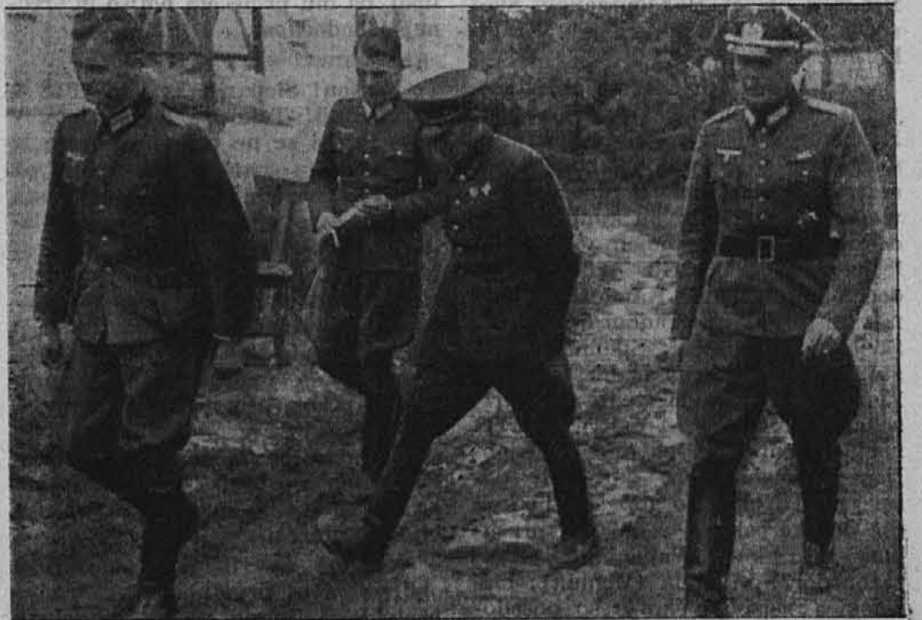
Vrhovni poveljnik 6. sovjetske armade, ki je bil v prostoru okoli Umana ujet.

Vrhovno poročilo nemške oborožene sile nadalje objavlja, da se v Ukrajini z uspehom nadaljujejo boji proti četam, ki se držijo ob nekaterih mostovih na Dajepnu. Pri tem so uničile hitre čete v