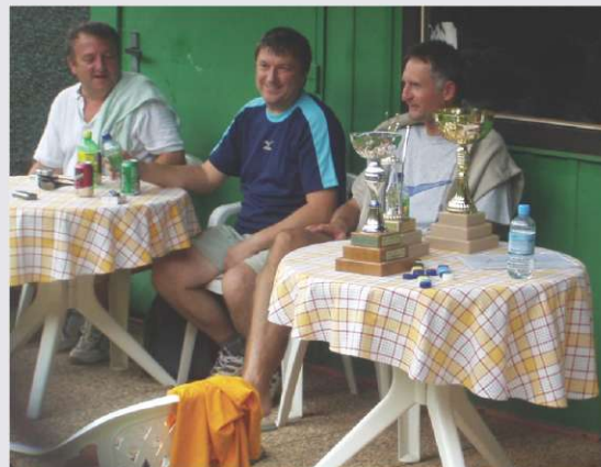
dobro razpoloženi navijači