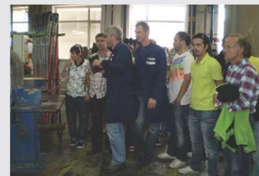
Švicarski trgovci so si z zanimanjem ogledali proizvodnjo

V sredini septembra nas je obiskala skupina trgovcev iz Švice, ki so si z velikim zanimanjem ogledali proizvodnjo smuči, jadrnic in snežnih desk ter kolekcijo smuči za sezono 2010/11 in nekaj drobcev za sezono 2011/12. Predstavili smo jim lepote Bleda in okolice. Nad celotnim obiskom so bili izjemno navdušeni in odšli v prepričanju, da se še kdaj vrnejo.