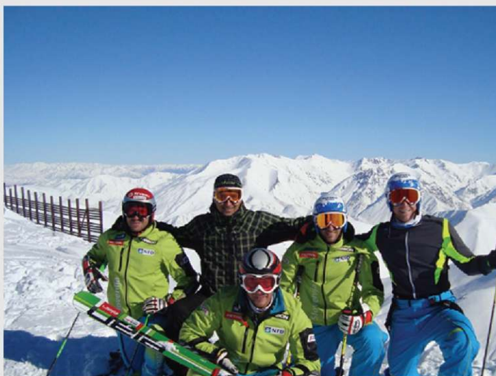
Elanovi smučarji na pripravah