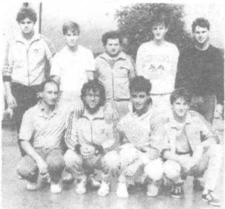
Na turnirju v malem nogometu se je najbolje odrezala moštvo »Jama Berda« iz Podpeč-Presej