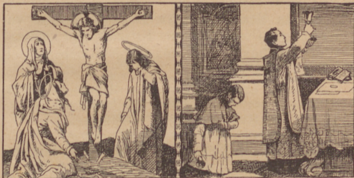
Juzus sze na krizsi aldije.

Opomba. Csi szí esese ne bio pri precsiscsávanji nigdar, z zselenjom szí je zseli. Csi szí zse bio, tð pa idi pogosztoma i vszigdar vredno k sztoli Goszpodovomi. Na den precsiscsávanja sze csuvaj szvetszkoga veszélja.