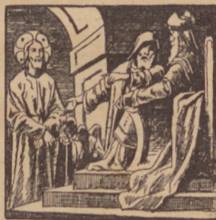
Jezusa kriviesno tozsijo.

Z lazsjov on pregrehsi ki ne govori isztine, naj bi drúgoga zapelao.