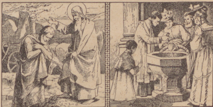
Filip okrszti dvorazkoga. Ocp. 10. 8, 98.

Opomba. Bvalo daj Bogi, ka je dao Szvesztva na tvoje poszveesenje. Vszikdár je vredno i sz potrebnim pripravlanjom vzemi, ar ovak ti ne szprávjio milosese, nego esese ti na kvar bodo.