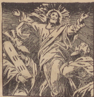
«Eto je moj ljubeni Szin.»