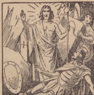
«Od mrtvih je gorisztano.»

* Jezus je v nedelo gorisztano, zaútra rano; szpomín njegovoga gorisztanjenja na vúzem , ali veliko noc obszlú-