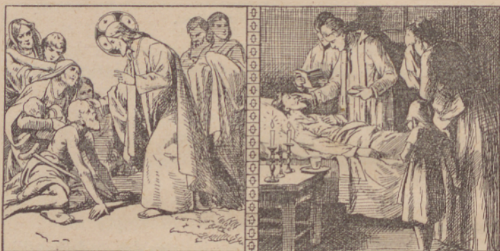
Jezus betezsníko vrácsi.

Opomba. Gda nam szv. Maticérkev odpúsztké deli, nasz ne odszlobodí od dúzsnosztí dobro esiniti i pokoro drzsati, nego nasz esce nagible na to, naj sze za tálnike trpljenja Jezusovoga vesinimo. Zátó sze szkrbi kak najvecs odpúsztk- kov dobíti tak za szebe, kak za purgatoriumszke dúse.