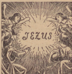
«Jezus Szvéto je ime njegovo.»

Sz preklinjanjon on pregrehsi, ki od Boga od Jezusa Krisztusa, od Szvesztv, od blazsene