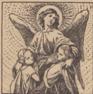
Szvĥti angel csuvar.

* Szvĥtek szvetih angelov csuvarov je prvo nedelo szeptembra.