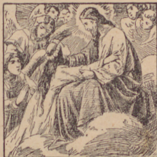
«Jezus vu n ebo vzeme d use odicsenih.»

Bog dobre vu neb eszaj z nezgovornim bl a-