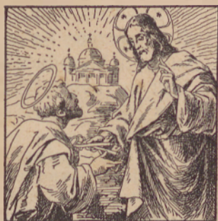
«Tebi dam klúcese kralesztva nebeszkoga.»

1. Od nasztlavlenja i ravnanja szvéte Materecérkve.