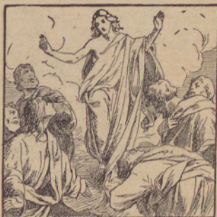
«Sztopo je vu nebésza.»

Opomba. Gorsztanenje Jezusovo te naj potrdi vu veri tvojoj, ka je on Bog, vu vtípanji, ka ti ednok túdi gorsztánes od mrtvih.