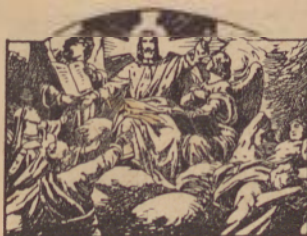
«Odnet pride szodit.»

Verjem vu Jezusi Krisz- tusi, ki... «odnet pride szodit zsive i mrtve».