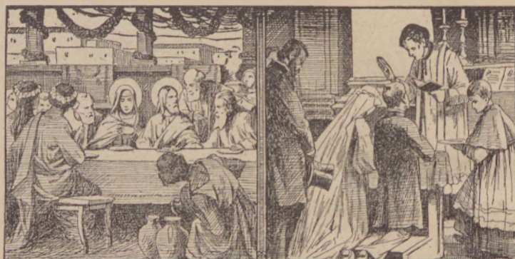
Jezus pri kanájszkoj szvatbi.

Opomba. Postij posvecene pope, ár szo oni szlúzsbeniki bozsi i voditelje tvoje duse. Za volo njihove csloveese szlaboszti ne zametávaj njihove szlúzsbe, nego ráj moli za njé.