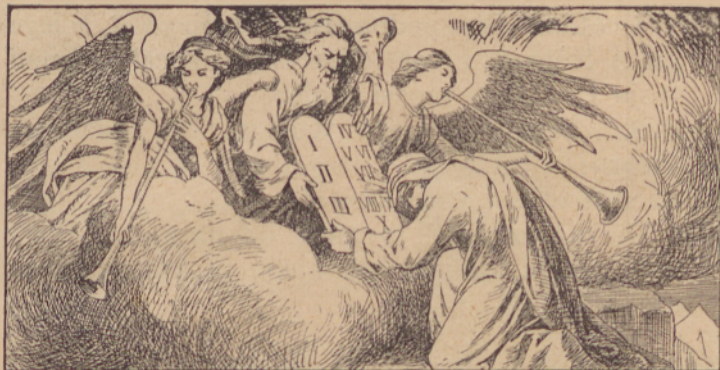
«Bog proklda Mojzesi deszetero zapovedi.»