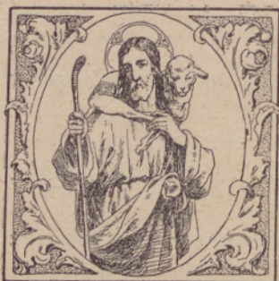
«Jezus, dober paszter.»