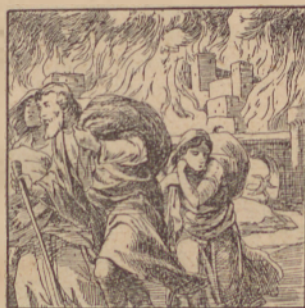
Bog pokastiga Sodomo.

* Na neszramnoszt pokvarjeni lüdje, lagoja drúzstva, nedozstojni kepi i cstenje, pijanesivanje ino nemárnoszt napelajo csloveka.