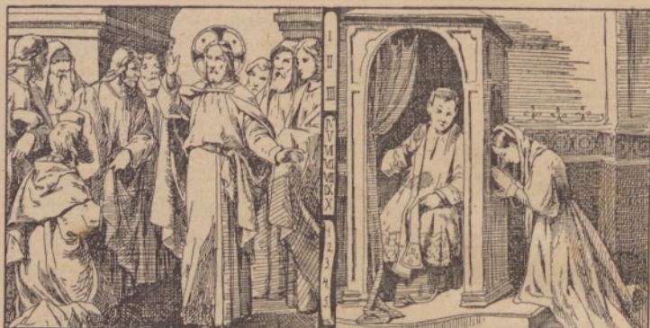
Jezus oblaszt dá apostolom na odpüscavanje grehov.