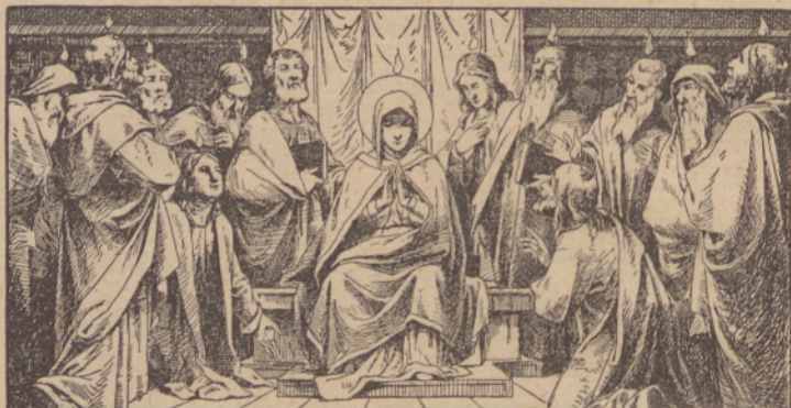
Prisoszijo Dŭha Szvetogu.