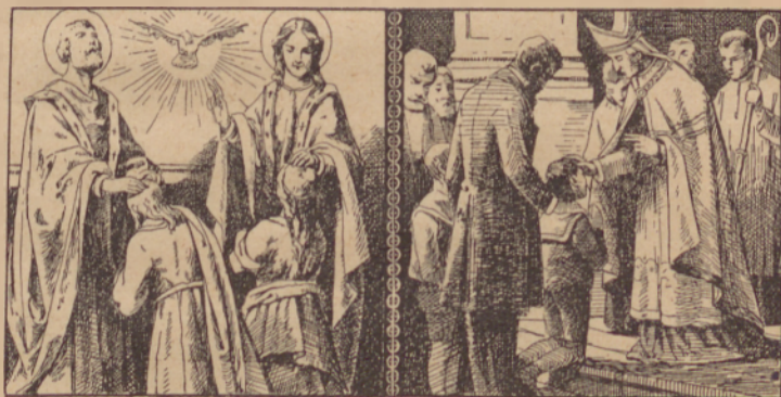
Szveli Peter i Janos firmata. Calh. sp. 8, 17.

Opomba. Nikdár ne pozábi, ka szi vu svz. Krszti Bógi obečsao i nikdár ne zamazsi obleke neduzsnoszti, stero szi vu szvétom Krszti dobo od Boga. Krsztno obečsánje vecskrát ponávľaj.