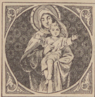
«Porodo sze je od Device Marije.»

65. Ka zadene to, ka je Szin bozsi cslovek posztano?