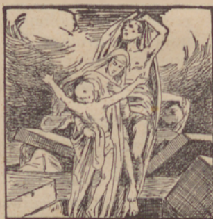
«Bog mrtve zbúdi.»

Telo csloveka vu zemli osztáne do konca szvejta.