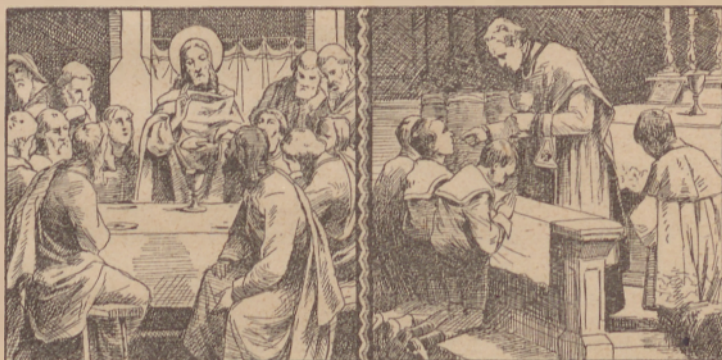
Jozus Oltarszko Szvesztvo nasztavi.

Opomba. Csi szí esese ne férmani, ne odlásaj szv. Ferme. Csi pa zse szí, te pa pokazsi pri vszakoj priliki, ka szí batriven vojak Krisztusov. Naszleduj zglied tvojega fermanszkoga patrona, steroga ime szí szí odebrao.