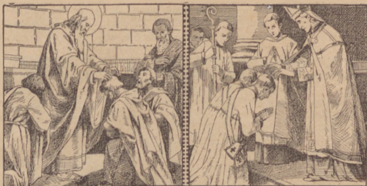
Sveti Pavol posvetí Thimoteja.