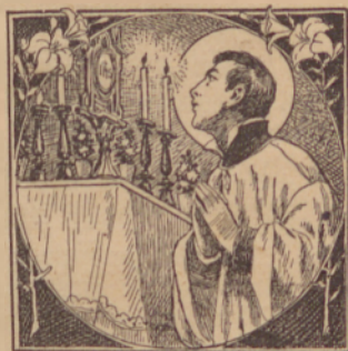
Szvéti Alojzjus molí Oltarszko Szvesztvo.

* Oltarszko Szvesztvo vu monstranciji (kazalnici) i vu kelihí drzsimo. Ta dvoja poszoda je vu tabernakulumi ,