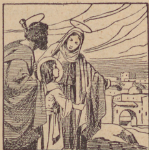
Jezus na szvetke v Jeruzalem ide.

Vu trétjój zapovedi nam Bog zapovedáva, naj dén Goszpodnov, to je: nedelo poszvetimo.