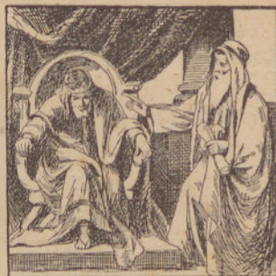
Nathan prorok pokara Davida.

* Szveta Maticérkev je od szamoga Jezusa Krisztusa dobila oblaszt ravnati verne, zato ona vu Krisztlusovom lmeni dava zapovedi. Jezus je sz etimi reesmi dao