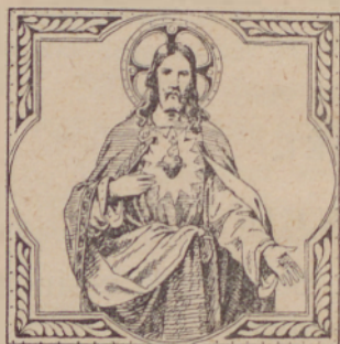
«Preszladko Szrce Jezusa, daj, naj tobe vszigdar bole lübitim».

Glavna zapoved to zsele od nasz, naj Boga vise vszega lübito, bliznjega pa, kak szamoga szebe.