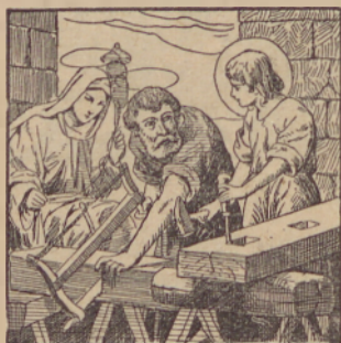
«Bío njim je pokorena.

Opomba. Verno poszvėti nedelo ino szi tak szpravi blagoszlov bozsi za prihodnoszt. Nedelszki pocsitek szi obrni na dusevni haszek, ne na ludobijo. Ne drzsi sz taksimi, ki nedele sz pijancsivanjom i z razvuzdanimi pleszami oszkrunjávajo.