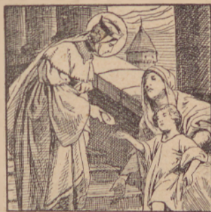
Szvéta Elizabeta álmstvo deli.

* Jezus je pravo : «Z toga vasz szpoznajo vszi, ka szte moji vucseniki, esi te lūbili eden ovoga».