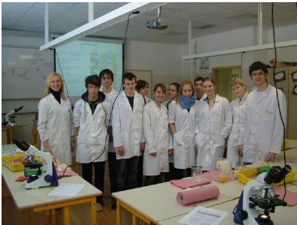
Gimnazijci pri laboratorijskih vajah povezujejo teorijo s prakso.