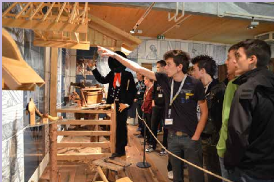
Strokovna ekskurzija v Avstrijo, 2013

Smo edina šola v Sloveniji, ki izobražujemo za poklic tapetnika.