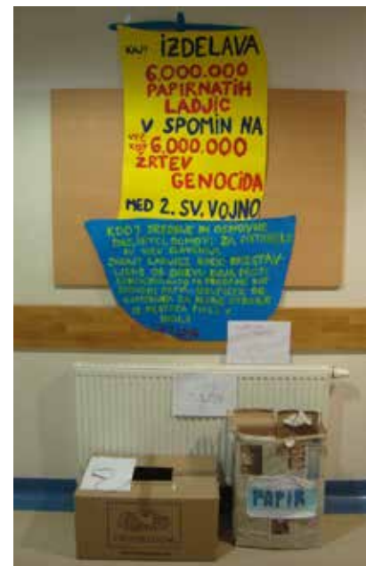
Dijaki so v decembru podprli akcijo izdelovanja ladjic v spomin žrtvam genocida med 2. svetovno vojno.