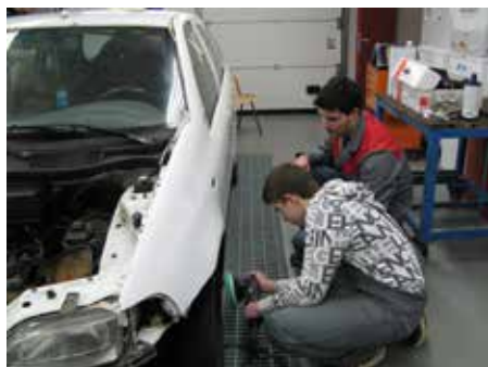
Avtokaroserist popravlja in vzdržuje dele okvirja vozil. Predelava v električno vozilo: Avtoservisni tehniki