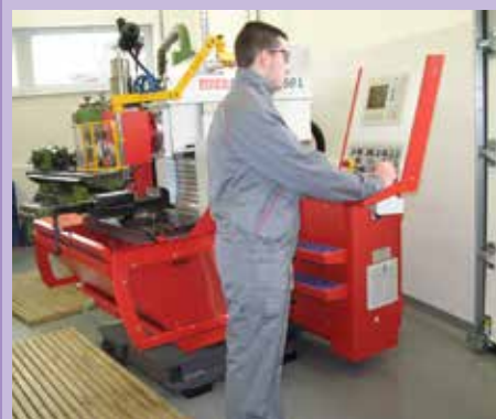
Stroji so mi blizu in rad upravljam z njimi.