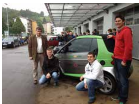
Predelava v električno vozilo: Avtoservisni tehniki so skupaj z mentorjem predelali klasično vozilo v električno.

AVTOSERVISER je usposobljen za vzdrževanje motornih vozil in motorjev z notranjim zgorevanjem. Povezuje znanja in spretnosti avtomehnika, avtoelektrikarja in vulkanizerja. Težišče dela je na sistematičnem iskanju napak na mehaničnih, pnevmatskih, hidravličnih, električnih in elektronskih sistemih motornih vozil; popraviljanju sklopov, nastavljanju osnovnih vrednosti, kontroli in presoji funkcije in