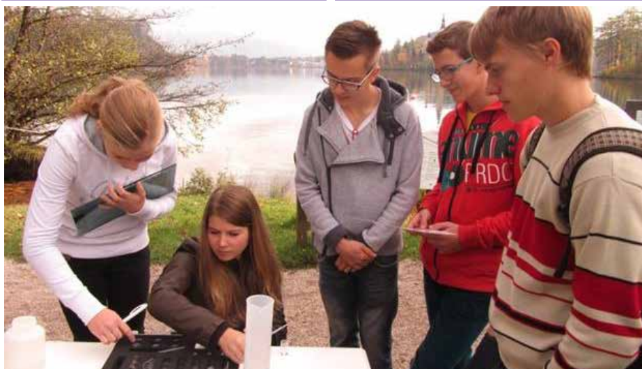
Skupina dijakov je med projektnimi dnevi raziskovala kvaliteto vode v Blejskem jezeru.

Gašper Stanonik, predsednik dijaške skupnosti