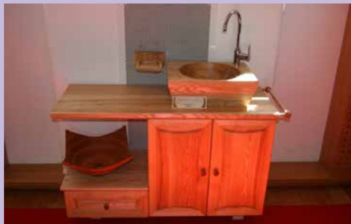
Razstava izdelkov, 2013: 1. (Gašper Oblak) in 2. (Gašper Dolenc) nagrada Območno obrtno-podjetniške zbornice Škofja Loka

ljudje, ki so dobro strokovno podkovani, z dovolj teoretičnega znanja in osvojenimi veščinami in spretnostmi opremljeni za nadaljnji študij ali zaposlitev.