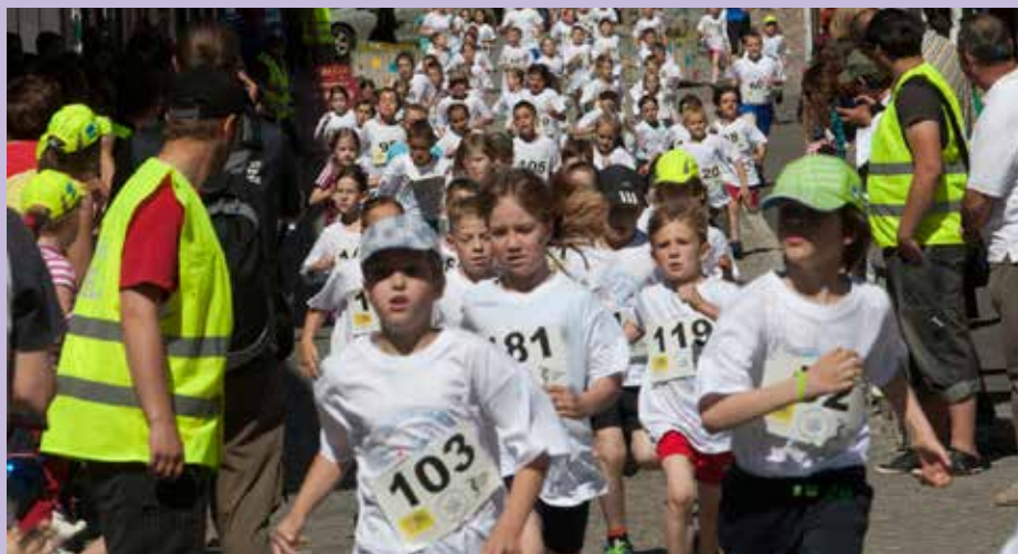
14.5. 2013 se je 1. UNESCO teka udeležilo 1500 učencev, dijakov in učiteljev ter 50 ambasadov teka.

Že četrtrič zapored smo bili kot edina slovenska šola izbrani v projekt ACES (Academy of Central European Schools). V globalnem projektu ENO (Environment Online) dijaki pridobivajo znanje in v razrednih projektih razvijajo ideje, kako ohraniti naš planet zdrav in čist.