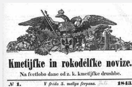
Slika 1: Naslovnica Kmetijskih in rokodelskih novic. 2

Živé naj vsi naródi, ki hrepené dočakat dan, da, koder sonce hodi, prepir iz sveta bo pregnan, da rojak, prost bo vsak, ne vrag le sosed bo mejak!